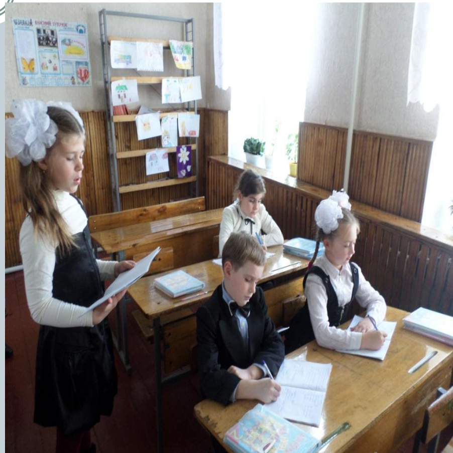
“Ажурна міні - пилка”