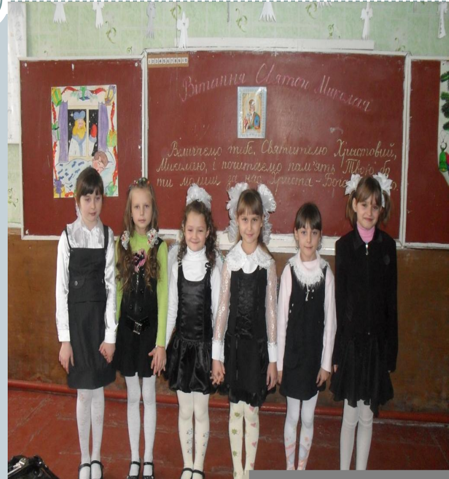
Проект “Життя Святого Миколая”