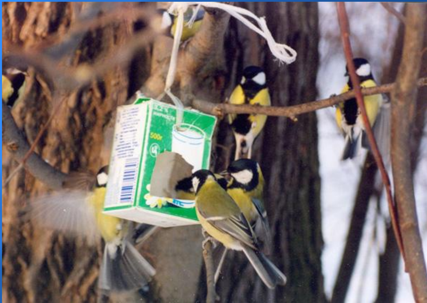
Перед стайкою синиц.