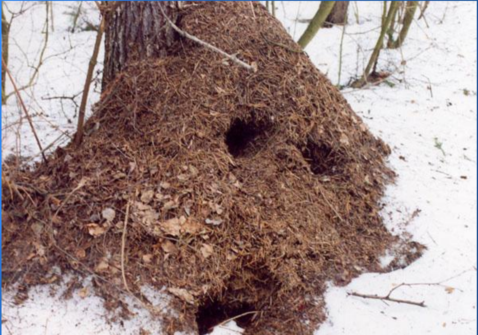
Работа дятла желна.