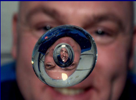
капля воды в невесомости