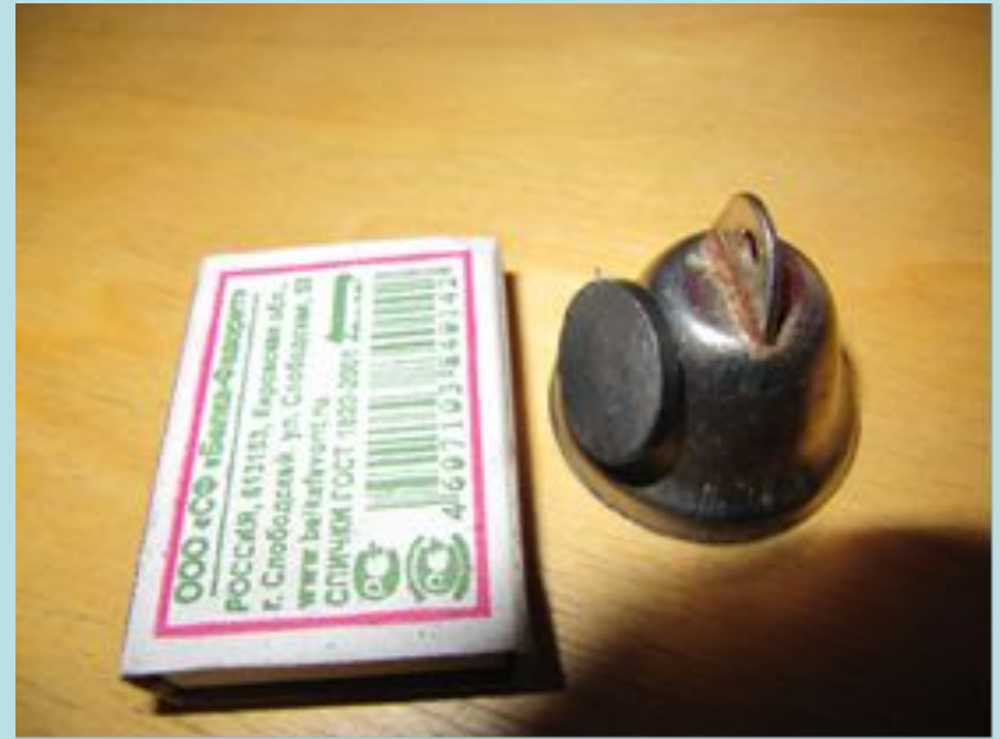
Подтверждение свойств магнита