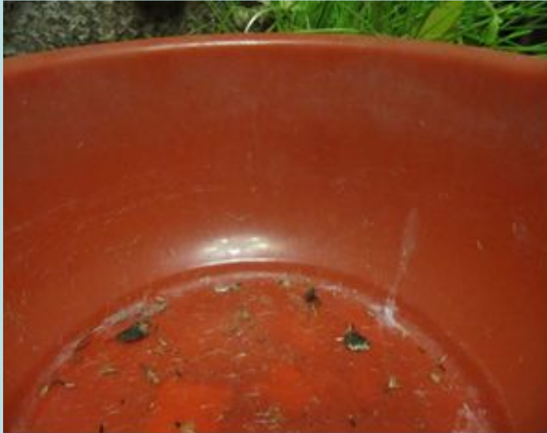
Осадок и мусор на дне таза