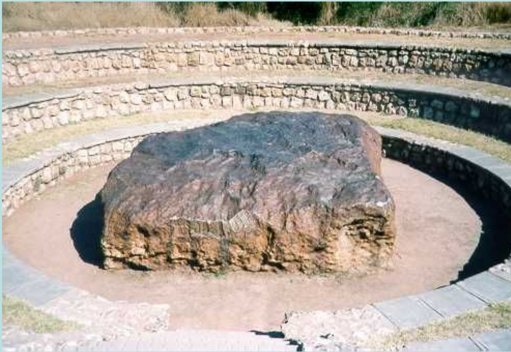
Гоба- крупнейший из найденных метеоритов

Геологи, химики и физики собирают и изучают метеориты уже более 200 лет. Хотя первые сообщения о падении метеоритов появились давно, ученые относились к ним весьма скептически. Разнообразные факты заставили их, в конце концов, поверить в существование метеоритов. Теперь считается, что метеориты - это фрагменты астероидов и комет. Метеориты делят на "упавшие" и "найденные".