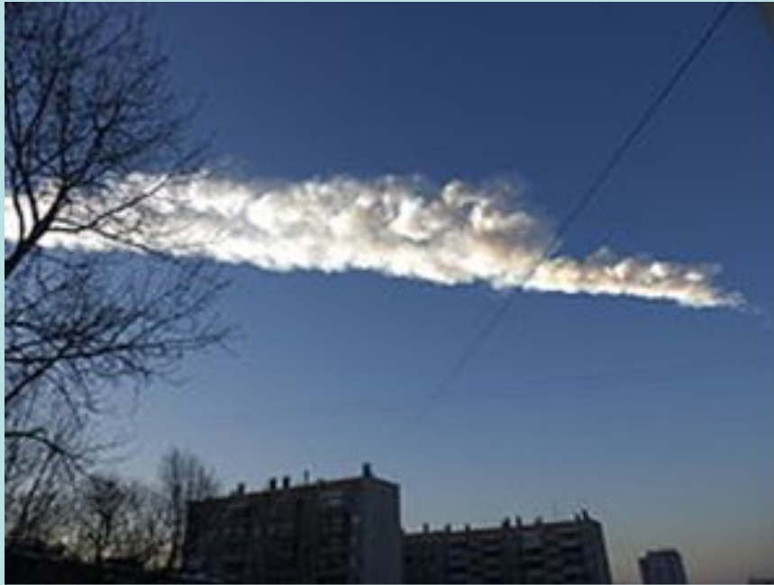
След от болида над Челябинском 15 февраля 2013 года