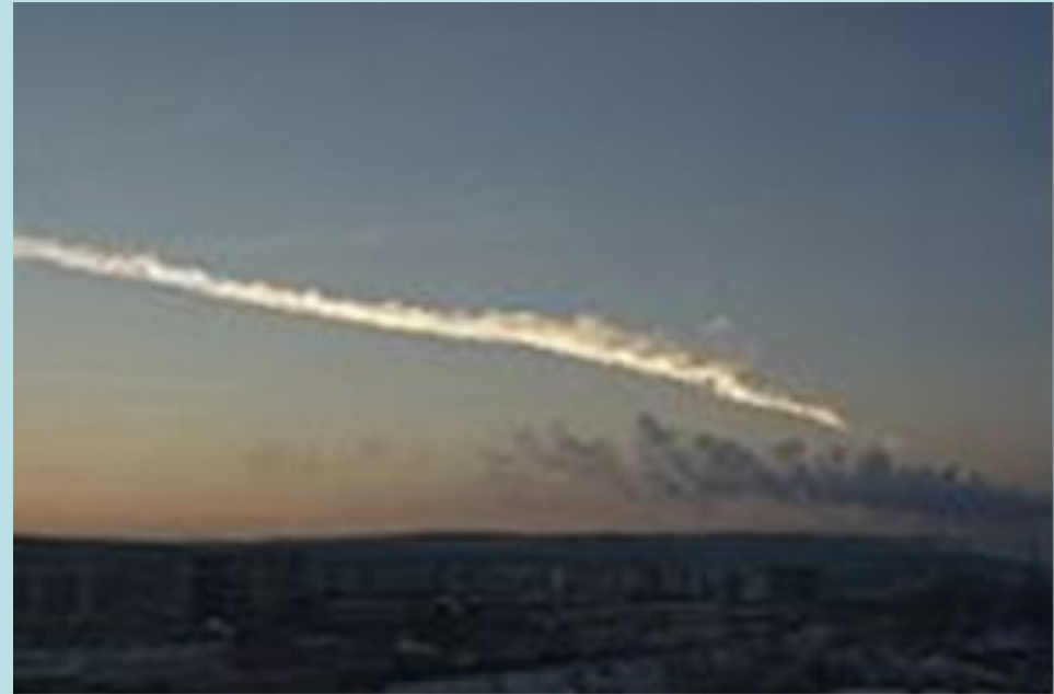
Вид из Екатеринбурга, примерно 200 км от эпицентра взрыва

Метеорит диаметром 17 метров и массой 10 тыс. тонн вошел в атмосферу Земли на скорости около 18 км/с.