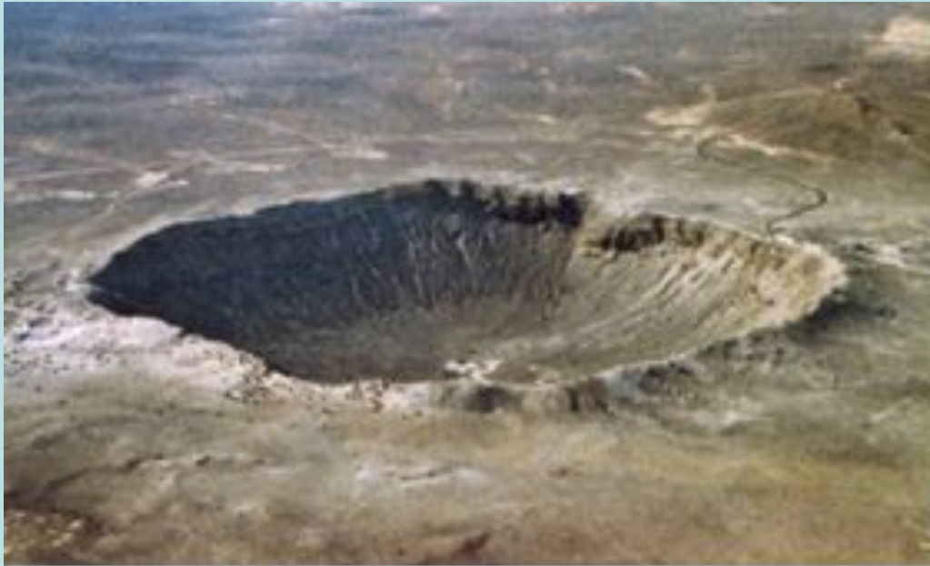
Кратер от падения метеорита в Аризоне

До тех пор, пока метеорит не достиг Земли, его называют метеороидом. На высоте около 100 км из-за трения о воздух метеороид начинает нагреваться, его поверхность раскаляется, и слой толщиной в несколько миллиметров плавится и испаряется. В это время его видно как яркий метеор. Крупные метеориты тормозятся незначительно и при ударе производят взрыв с образованием кратера.