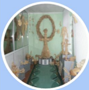
Музей солом'яного мистецтва «Солом'яне диво»