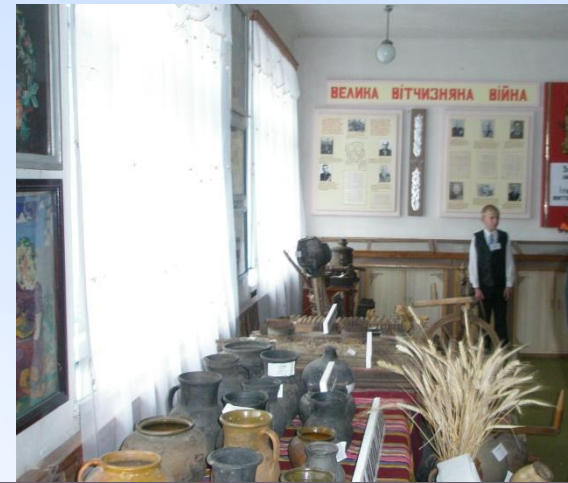
Музей історії села Новосілки