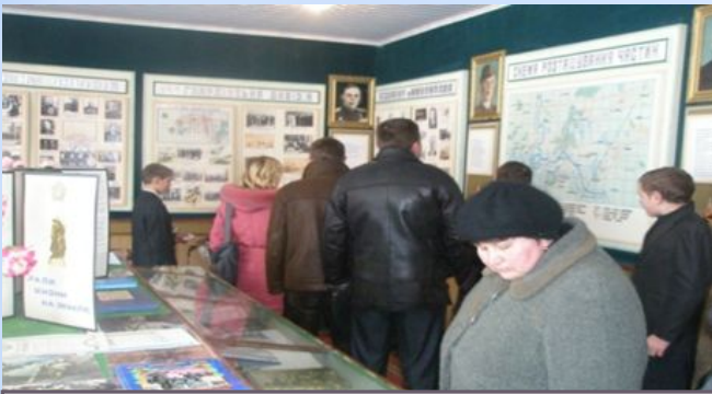
У музеї бойової слави ЗОШ І-ІІ ст. с. Мокрець