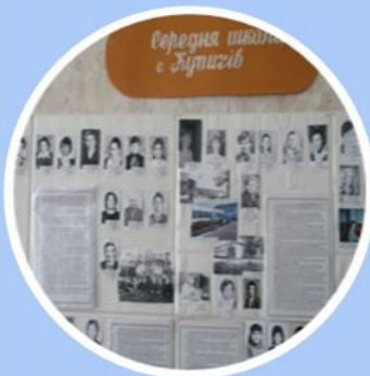
Музей історії села Купичів