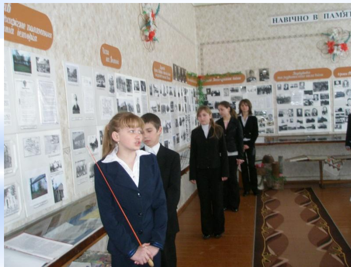
Музей історії села Купичів