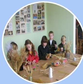
Працює студія "Житечко"- центр відродження народних промислів