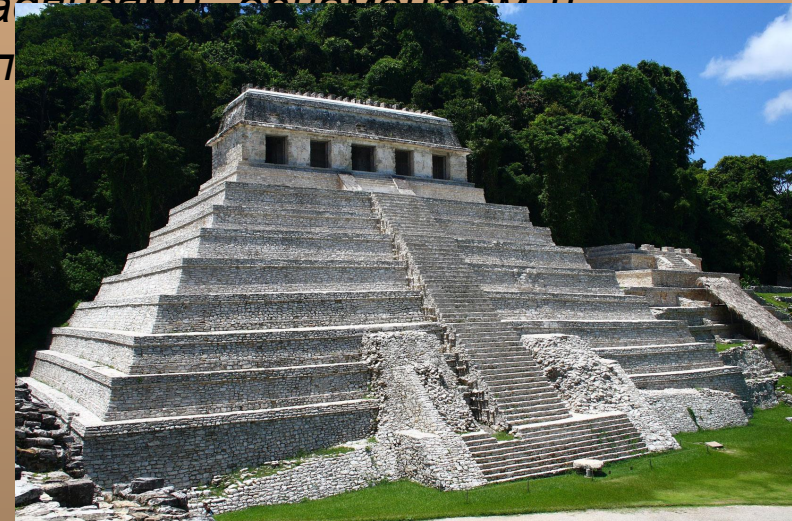
«Храм надписей» в Паленке

К типу церемониальных построек относились пирамиды, которые служили основанием храма, поднимая его как можно выше к небу; чаще всего храмы располагались именно на вершинах пирамид. Они были квадратными в плане, имели теснос внутреннее пространство (из-за толстых стен), украшались надписями, орнаментом и выполняли роль