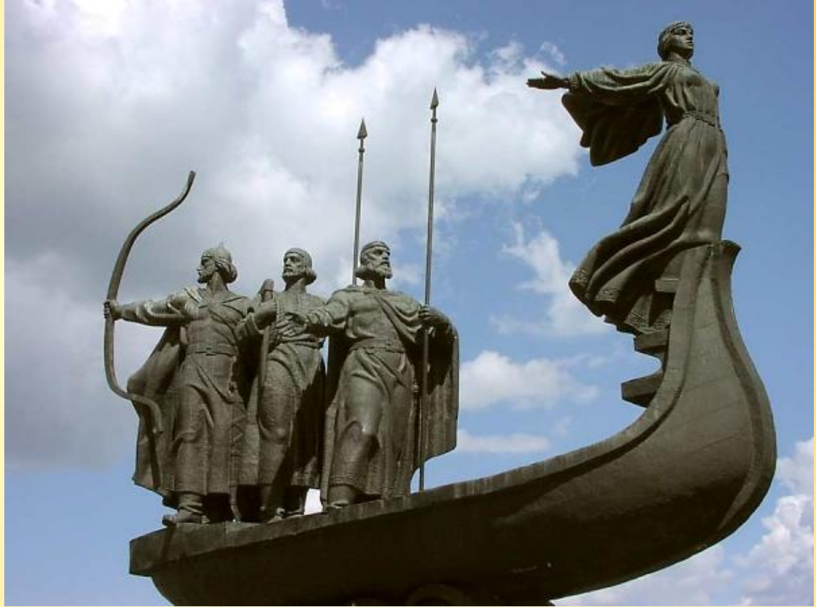
Памятник основателям Киева. Установлен в 1982 году. Авторы — скульптор В. З. Бородай, архитектор Н. М. Фещенко. Памятник находится на набережной Днепра