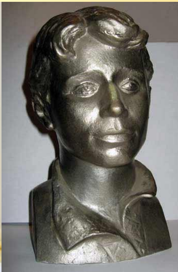
Есенин Год: 1980 г. Скульптор: Жмаев Ю. С.