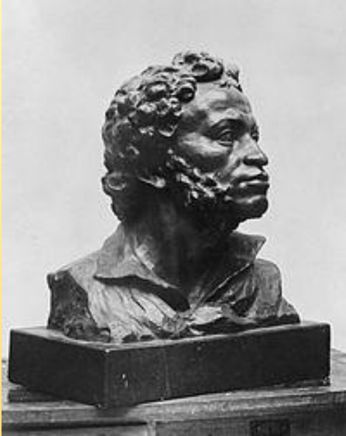
Владимир Домогацкий. Скульптурный портрет А. С. Пушкина. Бронза. 1926. Третьяковская галерея. Москва