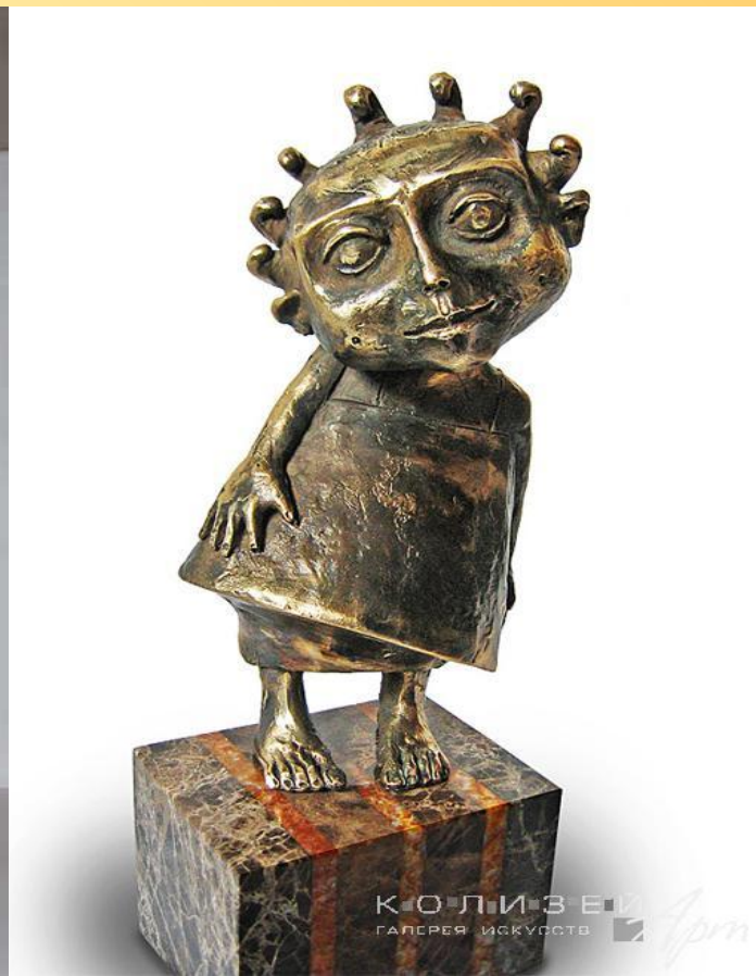
«Солнышко» Скульптор: Мавшов Петр Год: 2007