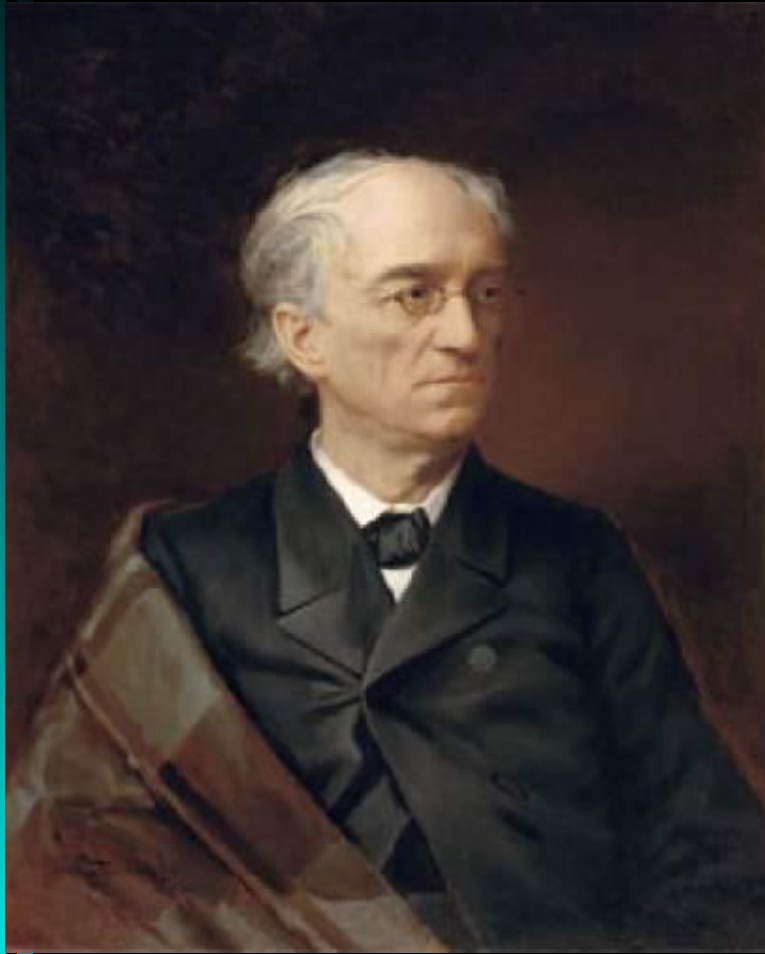
И. Ф. Александровский. Портрет Ф. И. Тютчева

В последние годы жизни Тютчев написал около пятидесяти стихотворений. Самые известные среди них: «Накануне годовщины 4 августа 1864 года» (1865), «Умом Россию не понять...» (1866), «Нам не дано предугадать...» (1869), «Я поздно встретился с тобою...» (1872) и др.