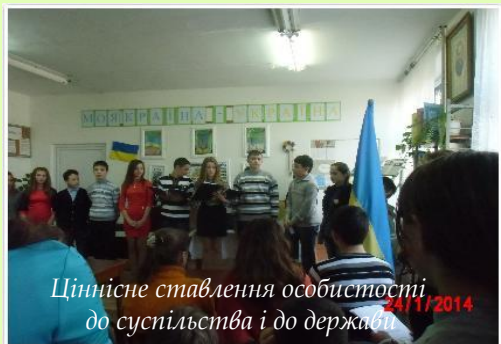
Ціннісне ставлення особистості до суспільства і до держави 24/1/2014

“Справжня суть виховної роботи полягає зовсім не у ваших розмовах з дітьми, не в безпосередньому вашому впливові на дитину, а в організації життя дитини” А.С.Макаренко