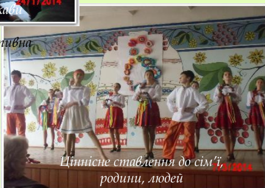
Ціннісне ставлення до сім'ї, родини, людей 17/2/2014