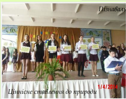
Пізнавальна колективна діяльність