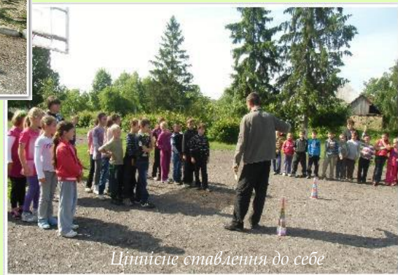
Ціннісне ставлення до себе