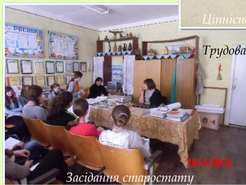
Трудова колективна діяльність