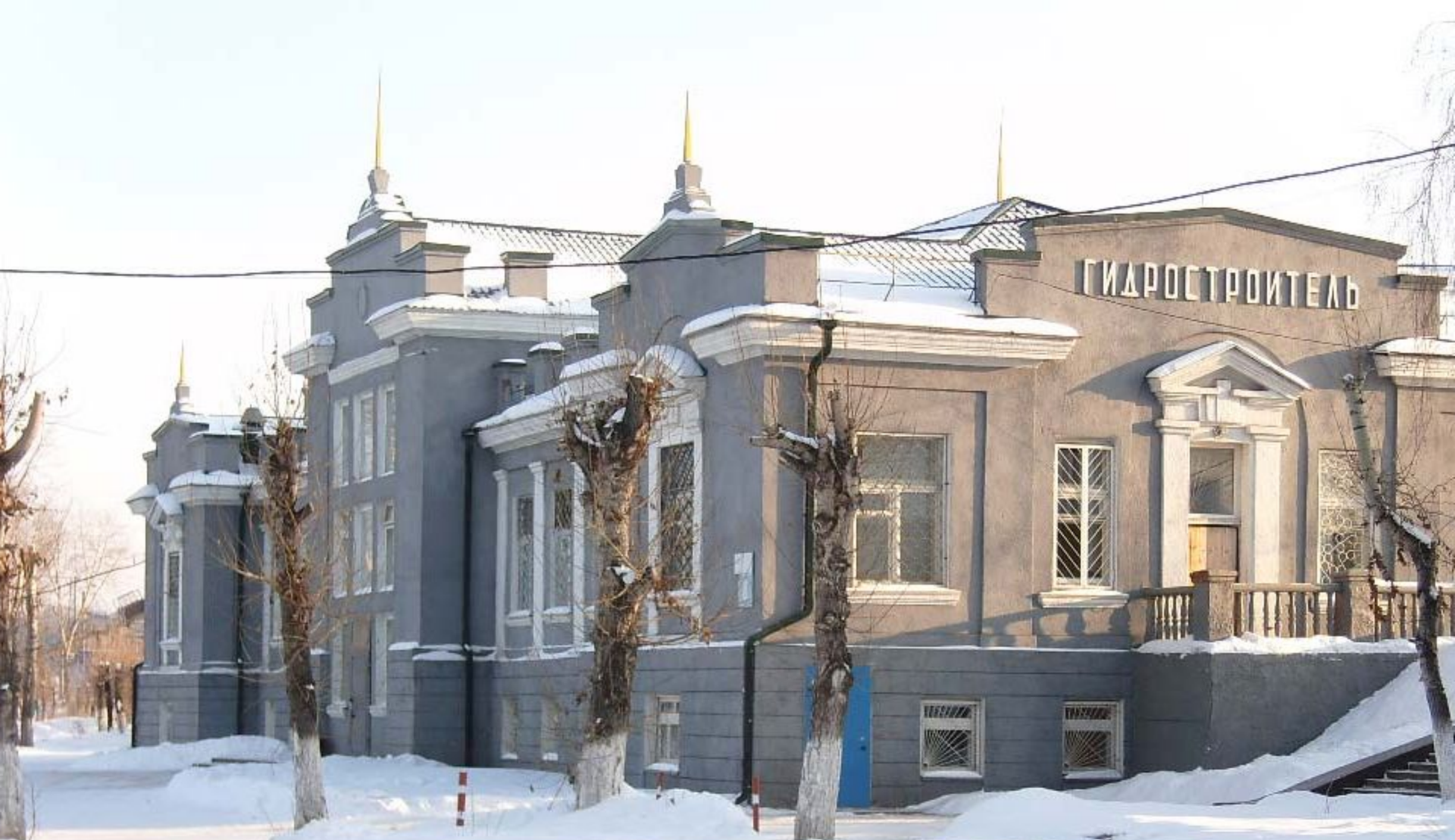
Ж/д вокзал в пос. Осиновка (станция «Гидростроитель»)