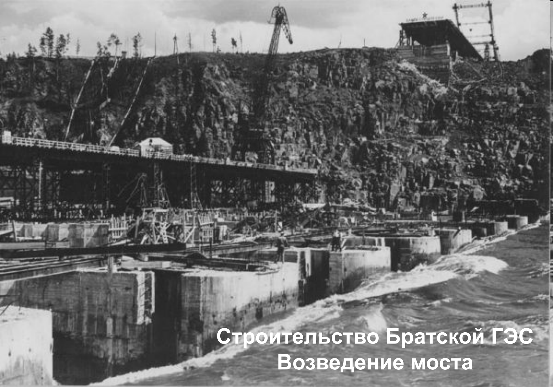
Строительство Братской ГЭС Возведение моста