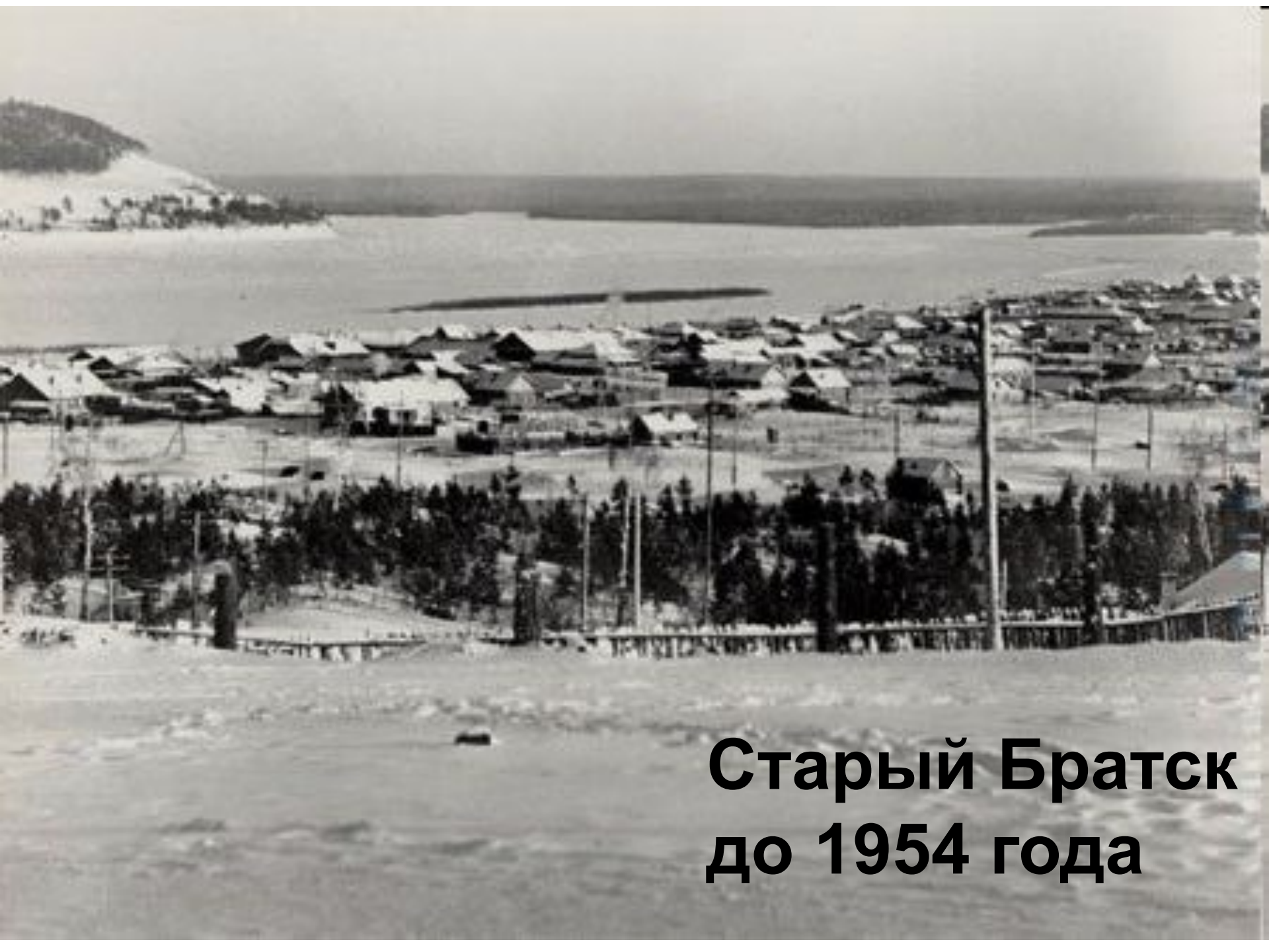
Старый Братск до 1954 года