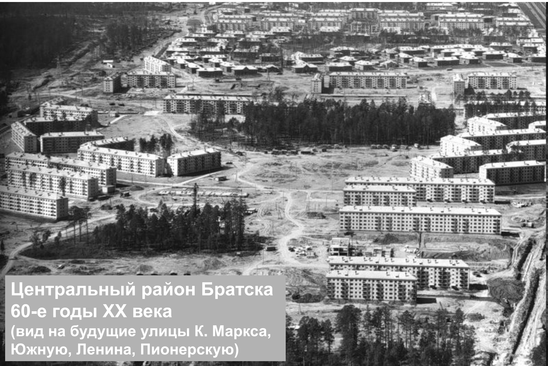
Центральный район Братска 60-е годы XX века (вид на будущие улицы К. Маркса, Южную, Ленина, Пионерскую)