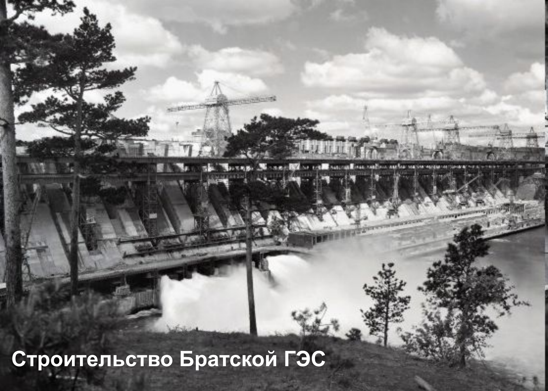
Строительство Братской ГЭС