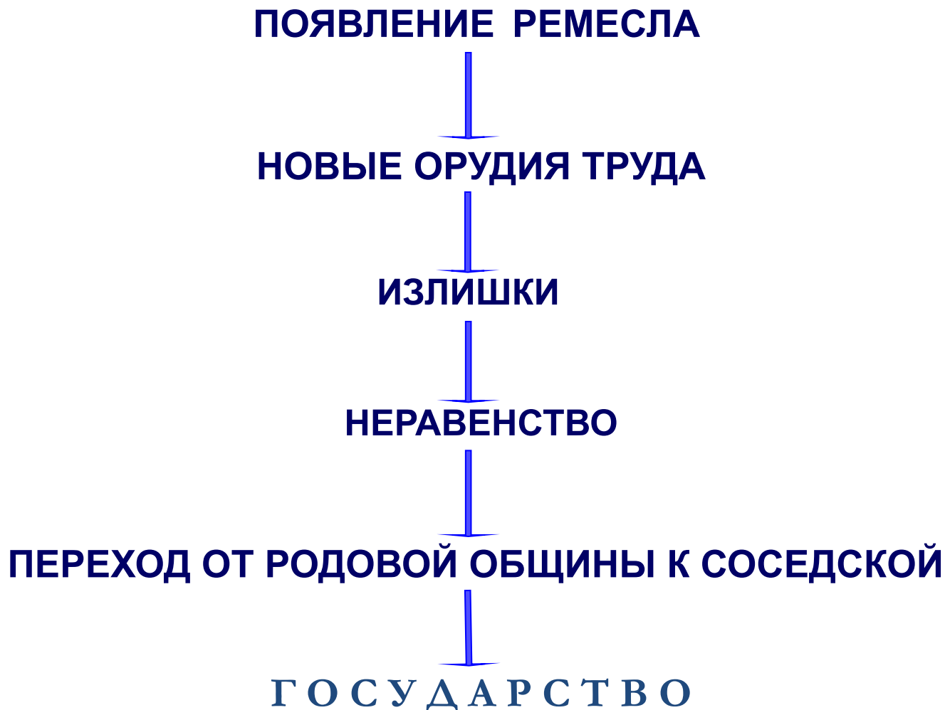
СХЕМА ЗАРОЖДЕНИЯ ГОСУДАРСТВА