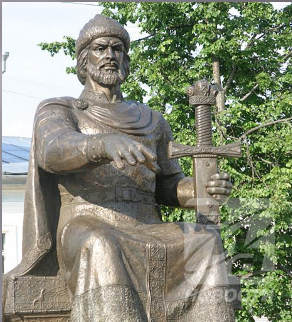
Памятник Юрию Долгорукому – основателю Костромы.