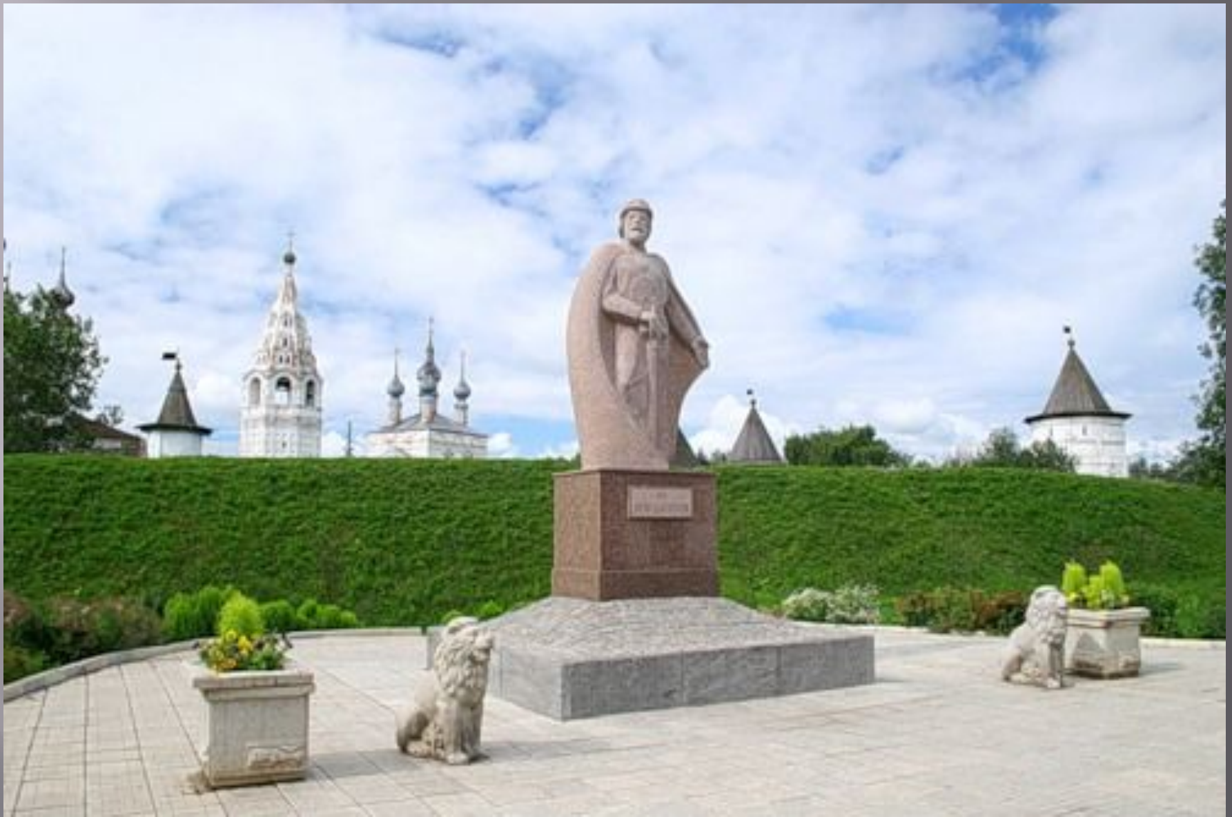
Памятник Юрию Долгорукому - основателю Юрьева-Польского