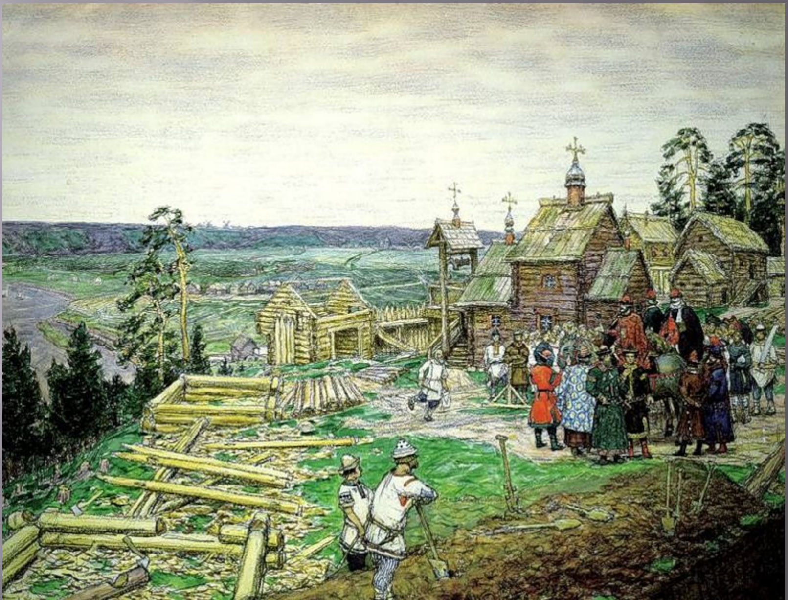
Юрий Долгорукий называет село Кучково Москва.