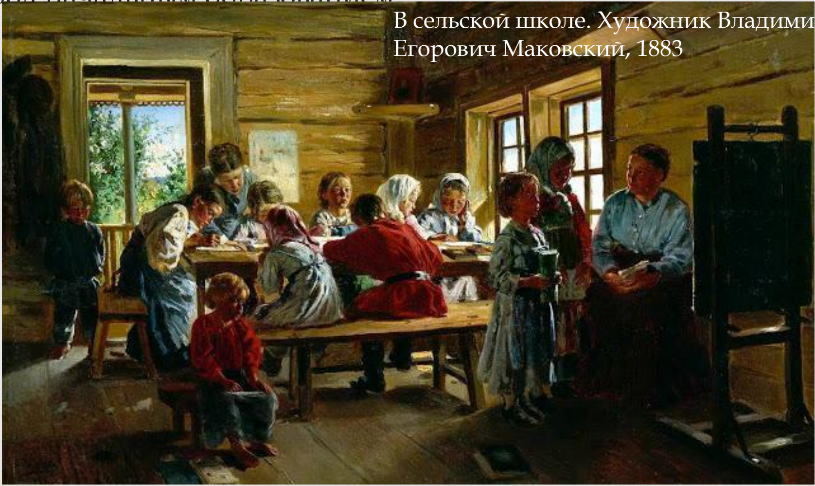
В сельской школе. Художник Владимир Егорович Маковский, 1883

В 1782 - 1786 годах, наконец- то была создана государственная система народного образования. Екатерина II долго работала над этим вопросом, и решила строить русское народное образование по австрийскому образцу. В 1782 году была создана Комиссия об учреждении училищ. По замыслам комиссии создавались училища двух типов: главные с 4-мя классами в губерниях, малые двуклассные в уездах. Такие училища должны были обеспечить народ начальным образованием.