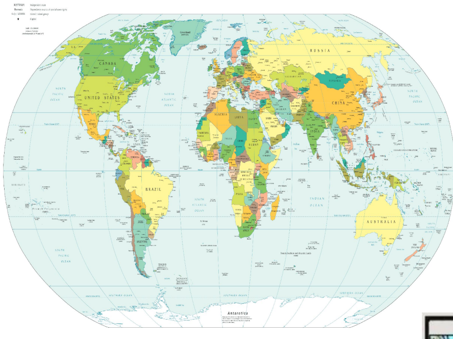
Political Map of the World, April 2007