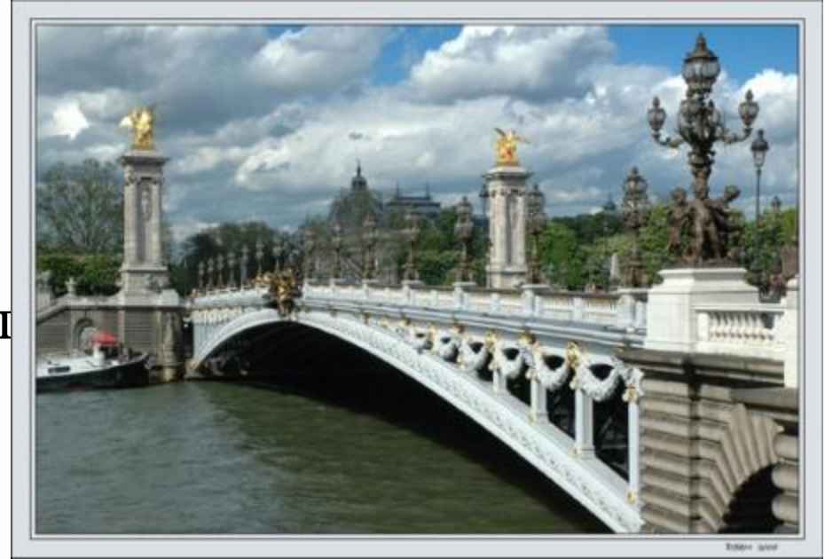
Мост Александра III в Париже