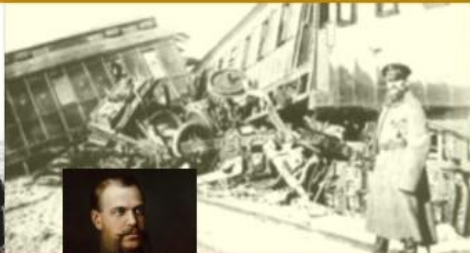
в октябре 1888 г.