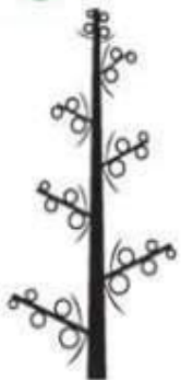
Схема сложного колоса