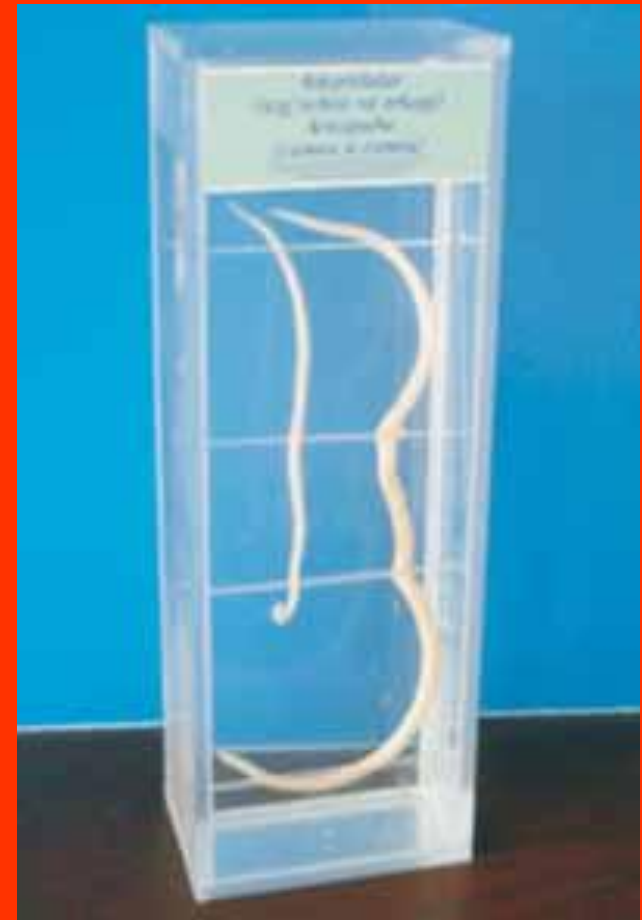
Влажный препарат аскариды

Скорость размножения и плодовитость колоссальны. Например, самка аскариды ( Ascaris lumbricoides ) способна отложить в день до 200 тыс. яиц.