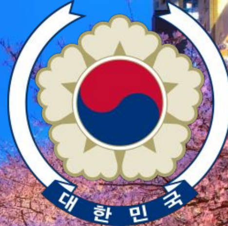
Герб республики Корея

Девиз : « 널리 인간 세계를 이롭게 하라 (Приносить пользу человечеству, 弘益人間) »