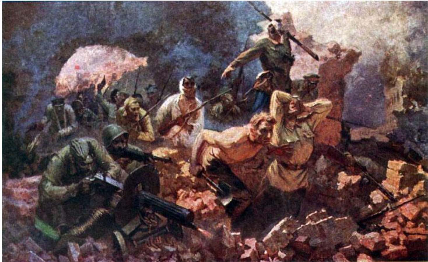
Е.Зайцев. «Оборона Брестской крепости в 1941 году»

До последнего сражались бойцы. Об этом говорят надписи на стенах крепости: «Прощай, Родина! Умрём, но не сдадимся!»