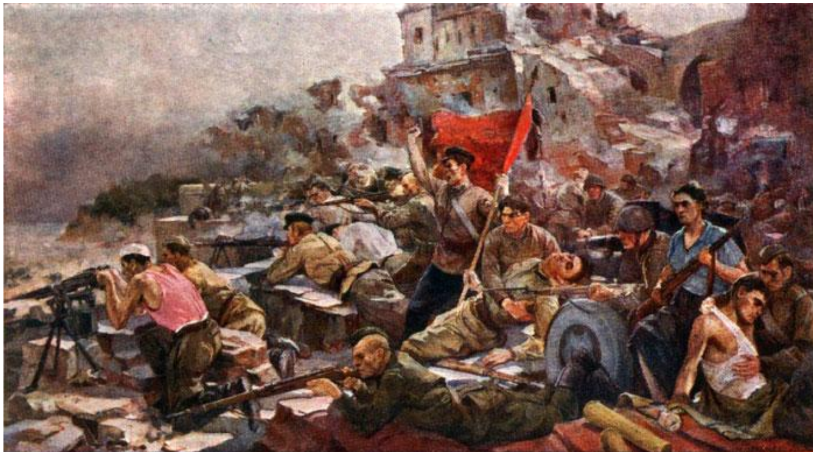
Е Зайцев. Оборона Брестской крепости.

Около месяца продолжалась героическая оборона. Ничто не сломило волю и мужество гарнизона.