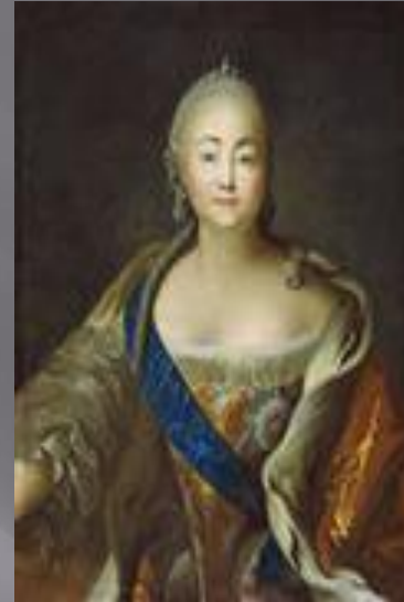
ЕЛИЗАВЕТА Дочь Петра I