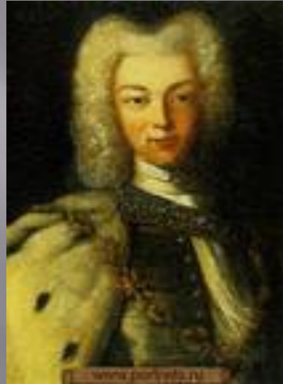
ПЕТР Внук Петра I