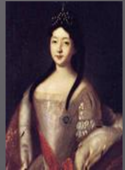
АННА Дочь Петра I