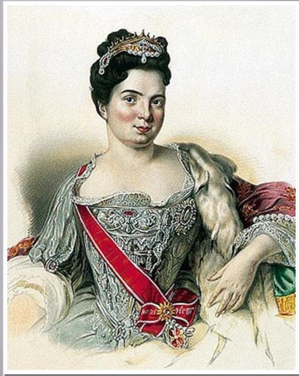
ЕКАТЕРИНА Жена Петра I