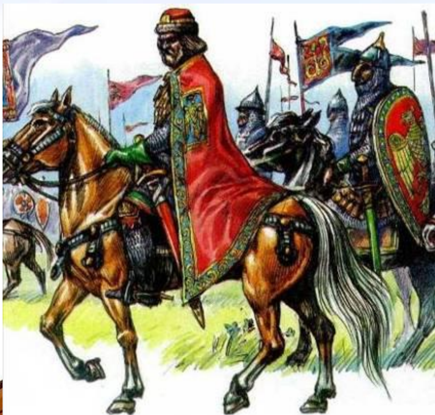
Князь с дружиной