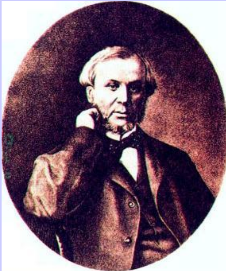
Николай Алексеевич Милютин