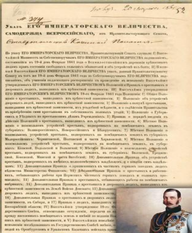
Указ императора Александра II о даровании крепостным людям прав состояния свободных сельских обывателей и об устройстве их быта. 2 марта 1861 г.