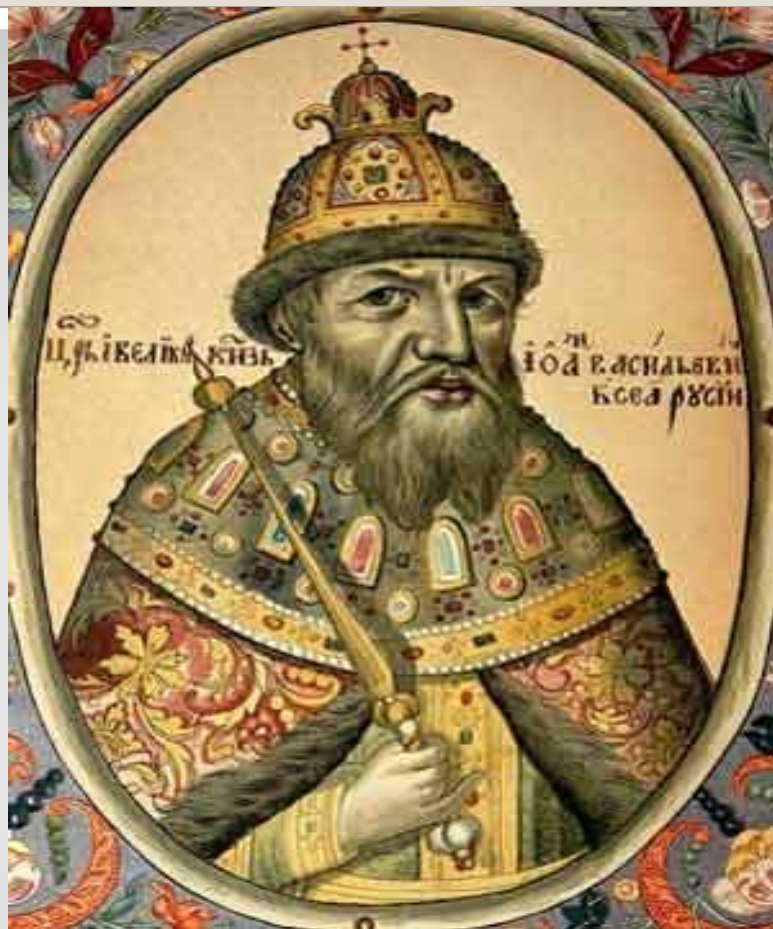
Иван III «Государь всея Руси»