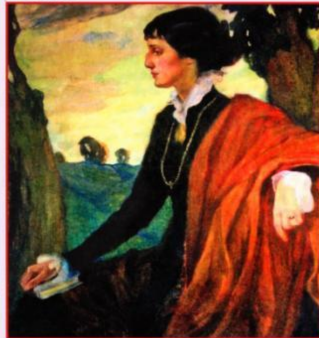
О.Л.Делла Вос-Кардовская. Портрет А.А.Ахматовой. Царское Село. 1915.

Ахматова выстояла, выстояла в значительной степени благодаря своим стихам, «священному ремеслу», с которым «и без света миру светло», благодаря своей способности слышать музыку природы и тишину земли, благодаря способности сочувствовать всем страдающим людям. Ахматова, сознавая естественность и неизбежность несчастья, преодолевает это несчастье и достойно противостоит превосходящим силам судьбы.