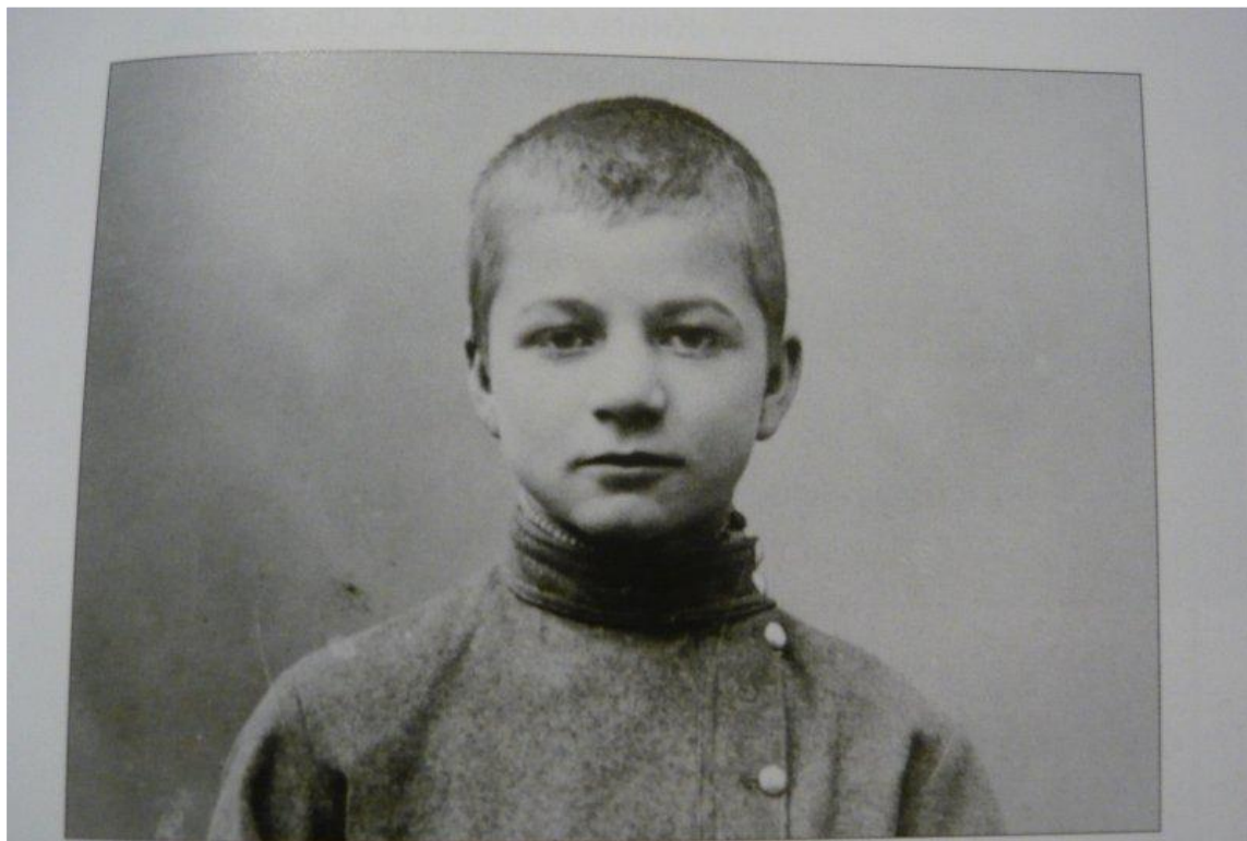
Андрей Климентов. Около 1909