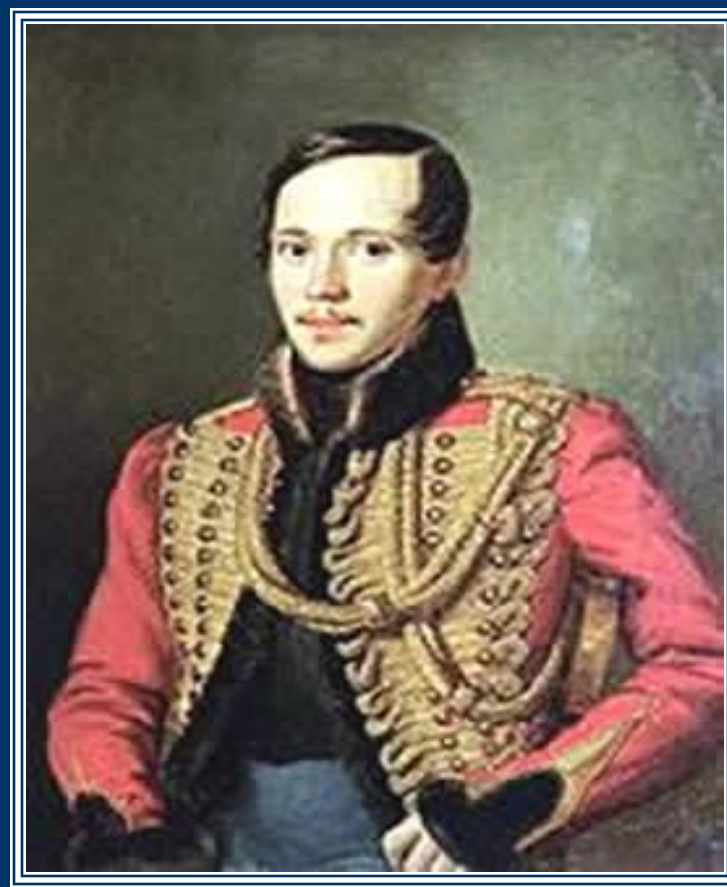
Михаил Юрьевич Лермонтов