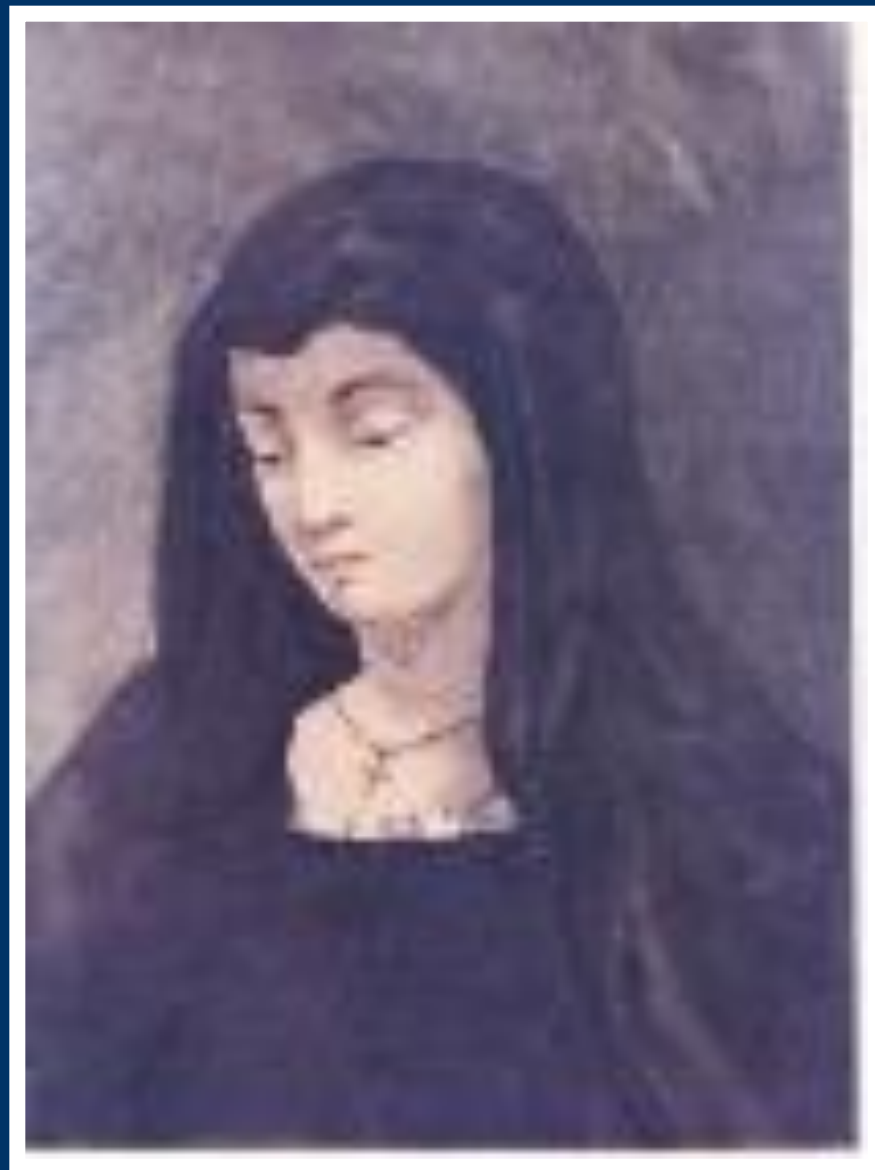
Варвара Лопухина в образе испанской монахини (картина М.Ю.Лермонтова)