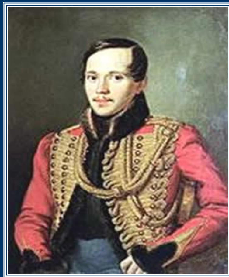
Михаил Юрьевич Лермонтов