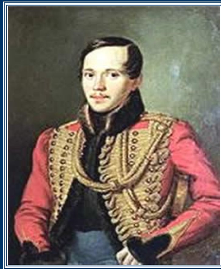
Лермонтов Михаил Юрьевич