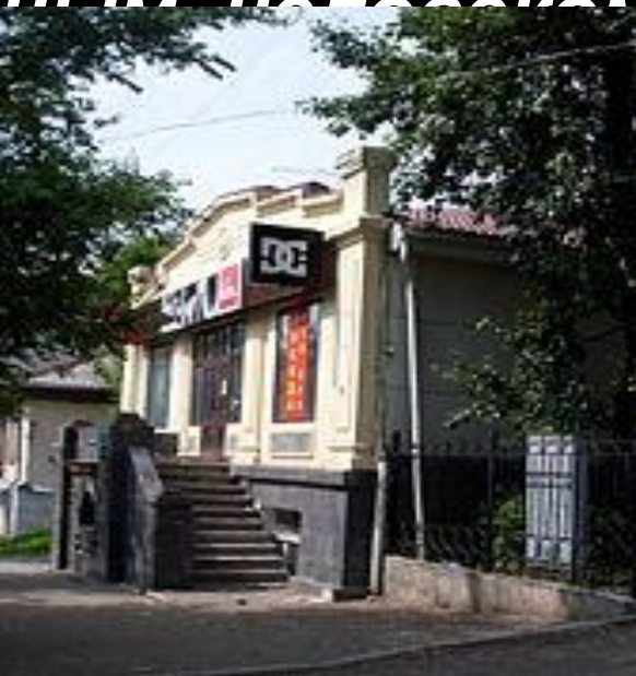
Здание в Хабаровске, в нём размещалась редакция газеты «Тихоокеанская звезда». В 1956 году на нём была закреплена мемориальная доска памяти Аркадия Гайдара