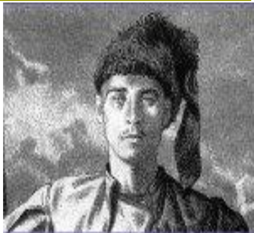
• Е.Корн. Андрий