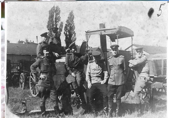
Серед фронтових друзів. Червень 1944 року.

С 1945 по 1948 год служил в комендатуре г. Дрездена