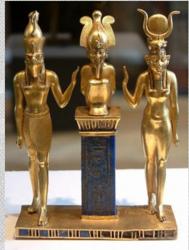
Гор, Осирис и Изида