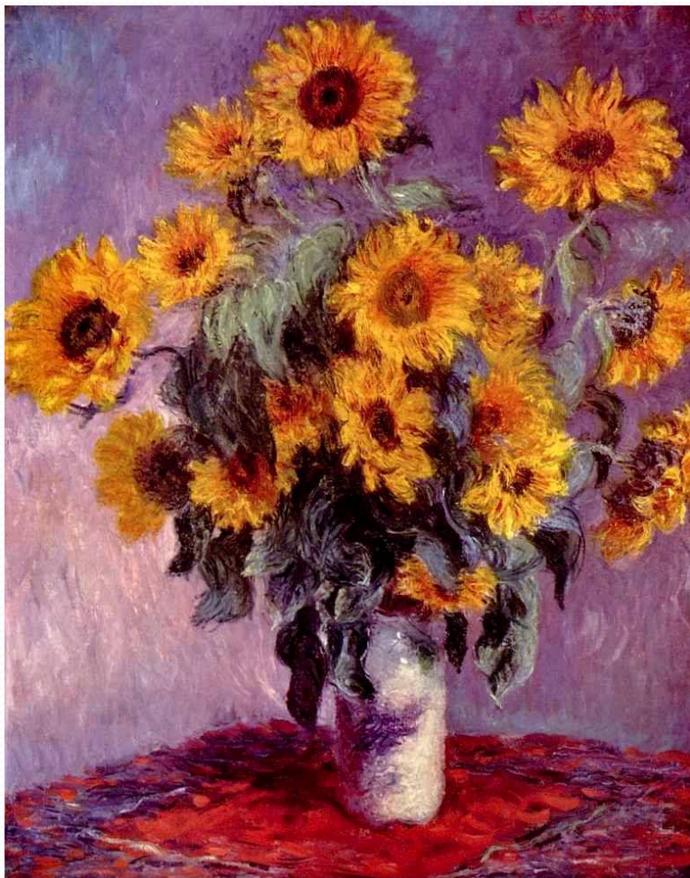
Подсолнухи. Год создания 1881