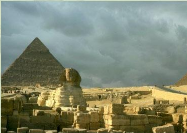
Пирамиды Древнего Египта.