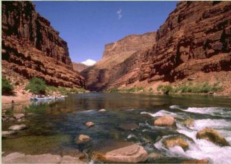
Большой Каньон Колорадо.