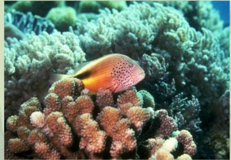
Большой Барьерный риф.

Узнать историю возникновения самого глубокого на суше Большого Каньона Колорадо вы сможете, прочитав статью Большой Каньон Колорадо .