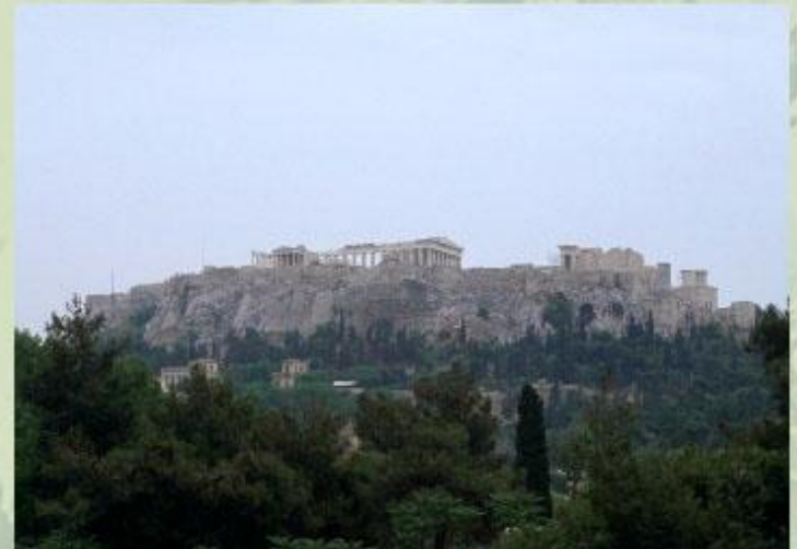
Афинский Акрополь - шедевр античной архитектуры.

Узнать об одном из древних «семи чудес света» - египетских пирамидах - вы сможете из статьи Египетские пирамиды .