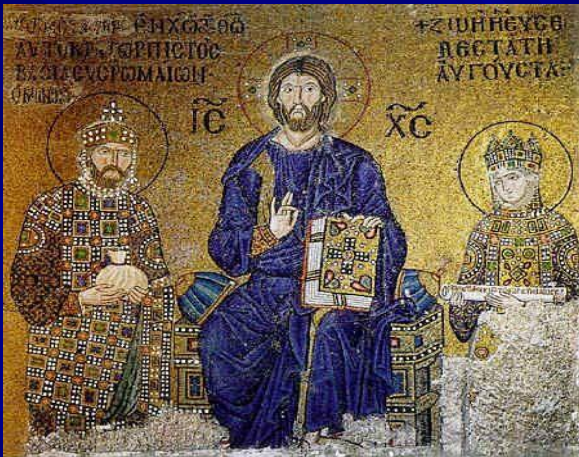
Приношение даров императором Константином IX Мономахом и императрицей Зоей