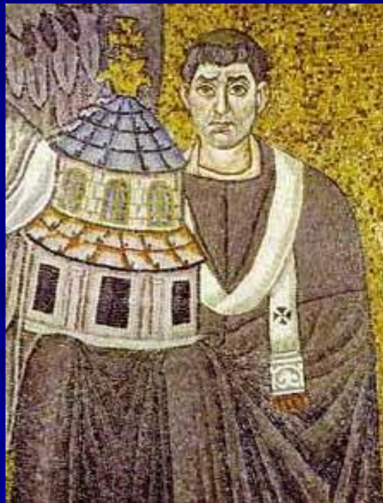
S. Vitale, Ravenna Apse mosaic Detail