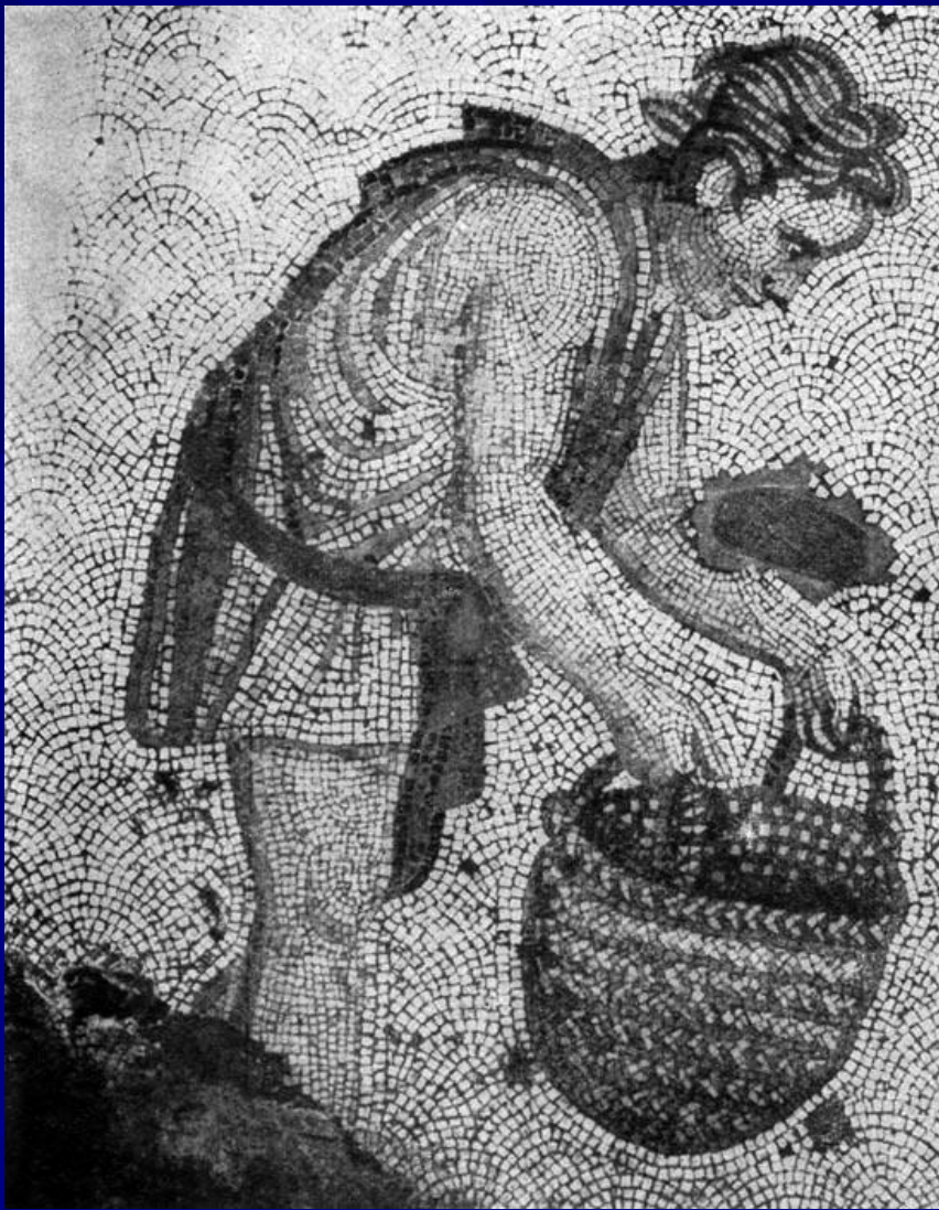
Фрагмент мозаичного пола Большого дворца императоров в Константинополе. 5 в.