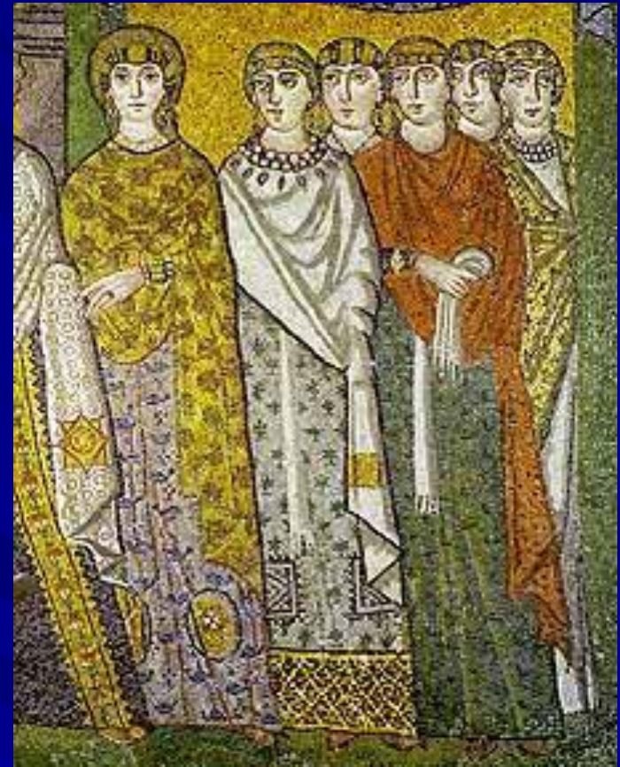
Theodora with courtiers Detail S. Vitale, Ravenna