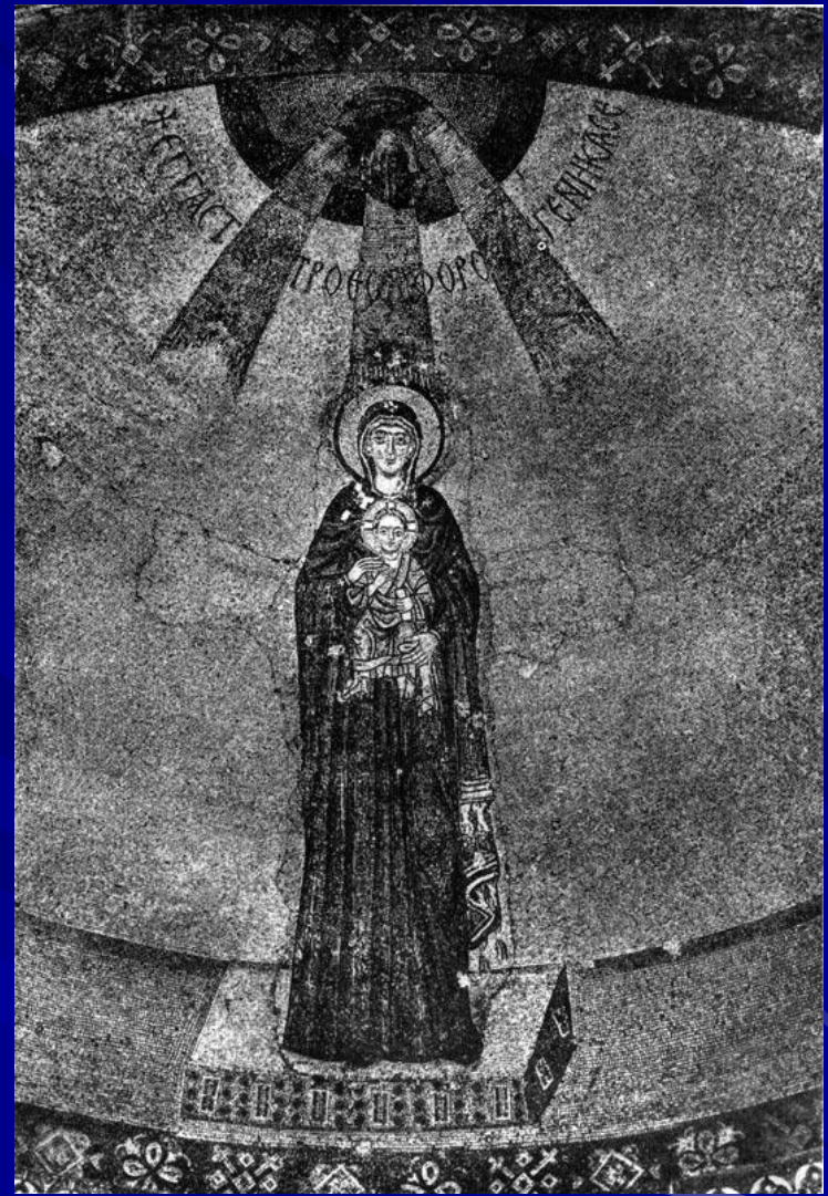
Богоматерь с младенцем. Мозаика абсиды церкви Успения в Никее. Вскоре после 787 г.