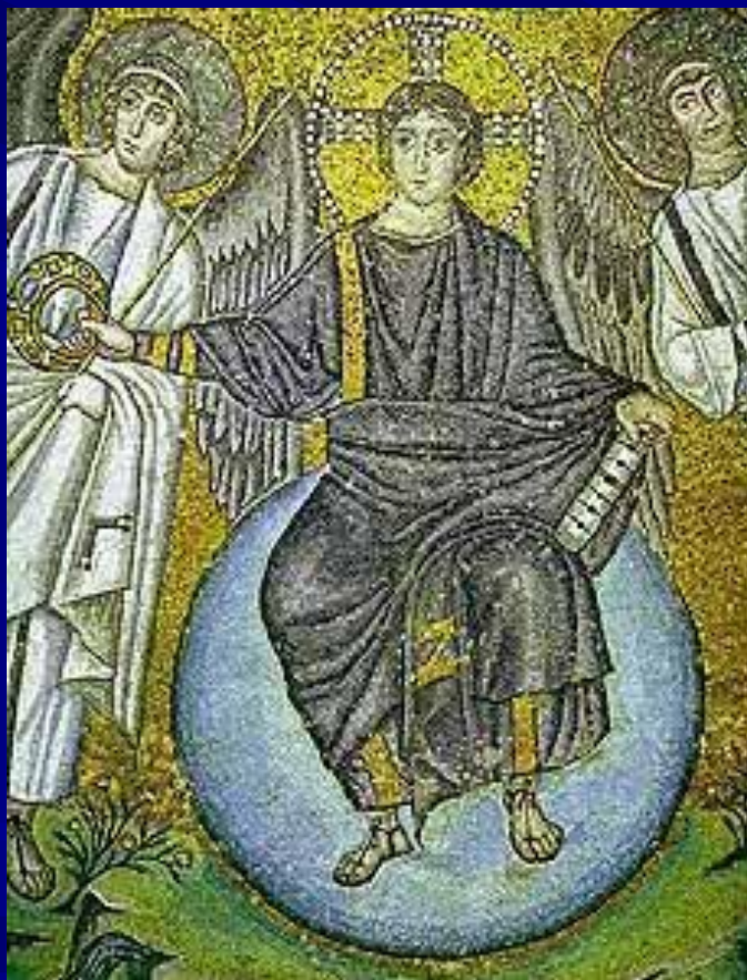
S. Vitale, Ravenna Apse mosaic Detail