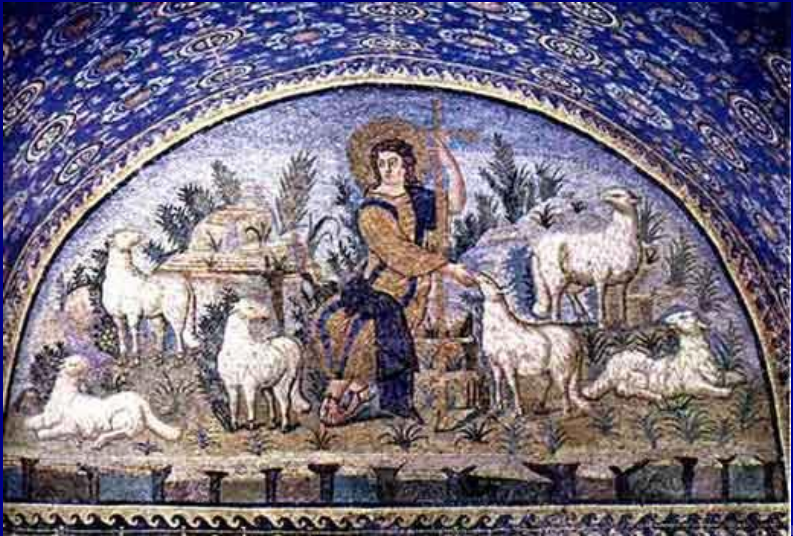
Добрый пастырь. Мавзолей Галлы Плацидии. Равенна