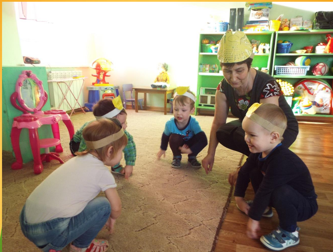
Подвижная игра «Вышла курочка гулять»