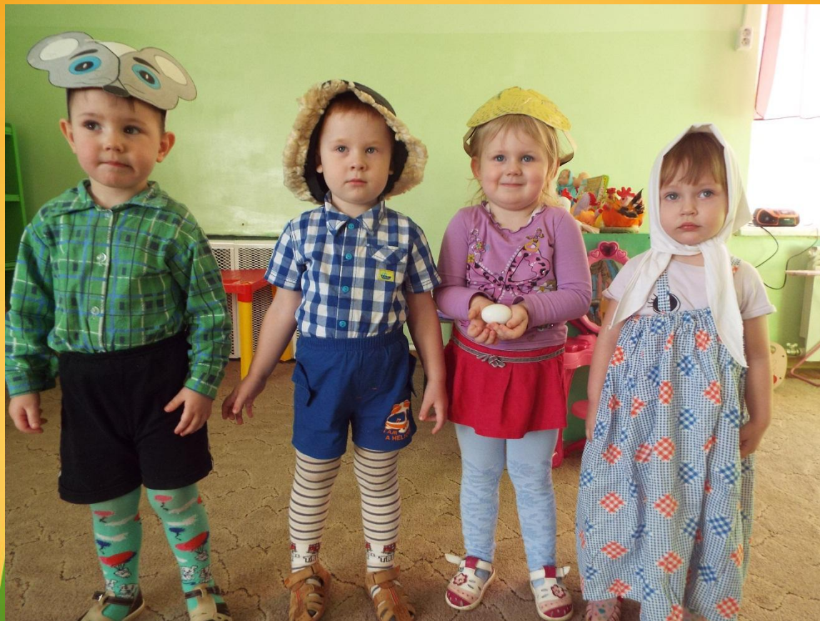
Игра-драматизация по сказке «Курочка Ряба»