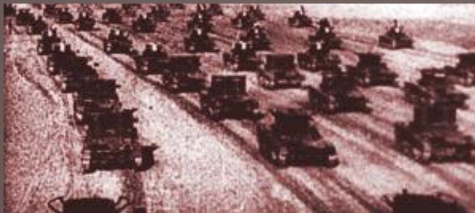
Советские танки пересекают польскую