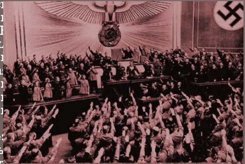
Гитлер сообщает депутатам Рейхстага о захвате Австрии