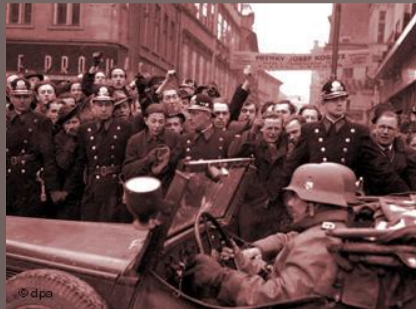
Немецкие войска вступают в Прагу