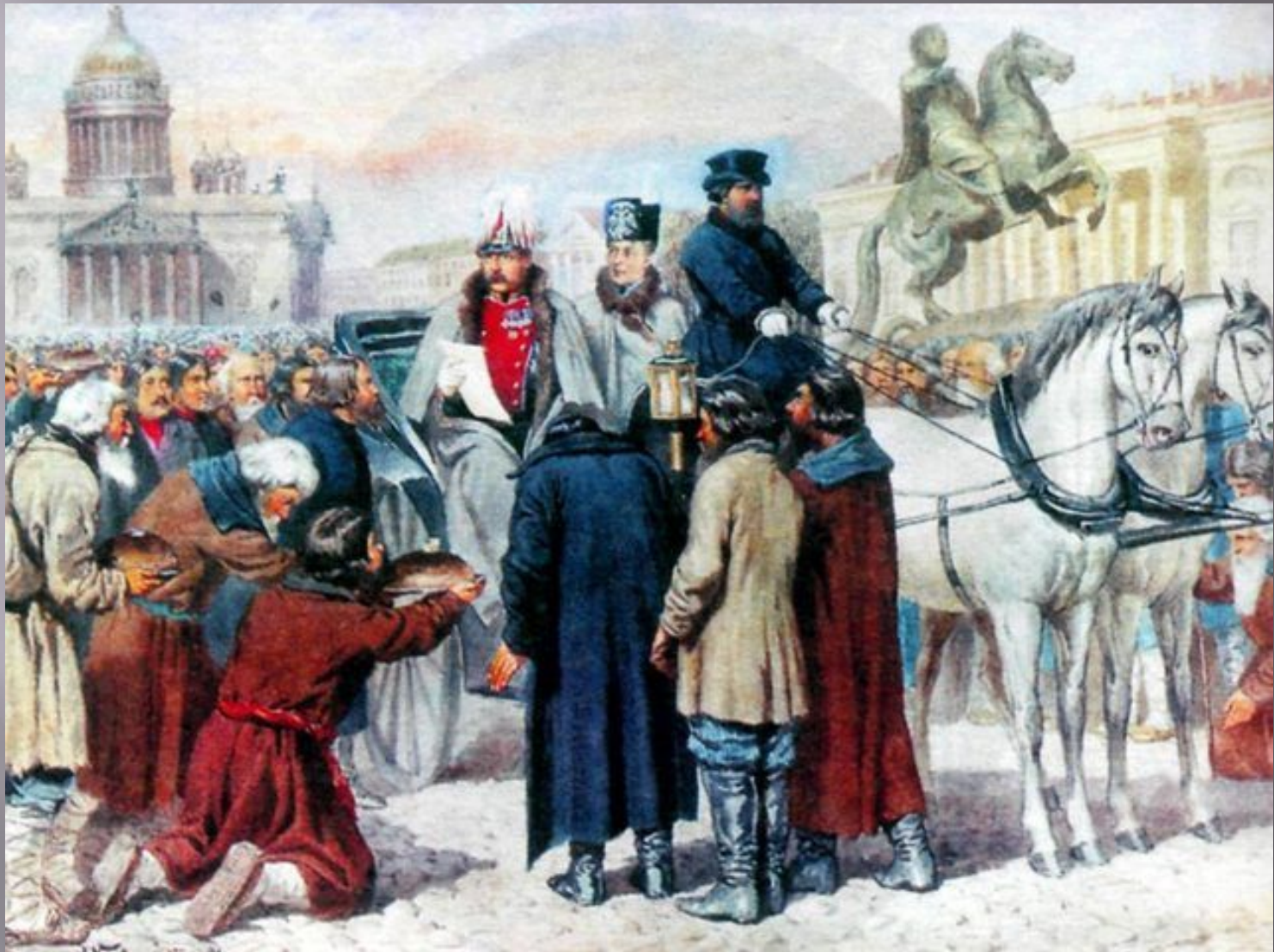
Чтение манифеста 1861 года Александром II на Сенатской площади