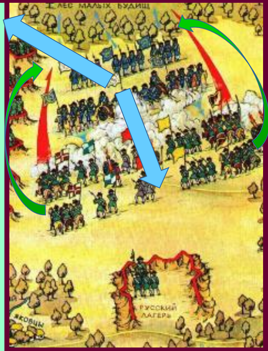
II этап Полтавской битвы.

В решающий момент, Петр взял Новгородский полк и нанес противнику удар на правом фланге.