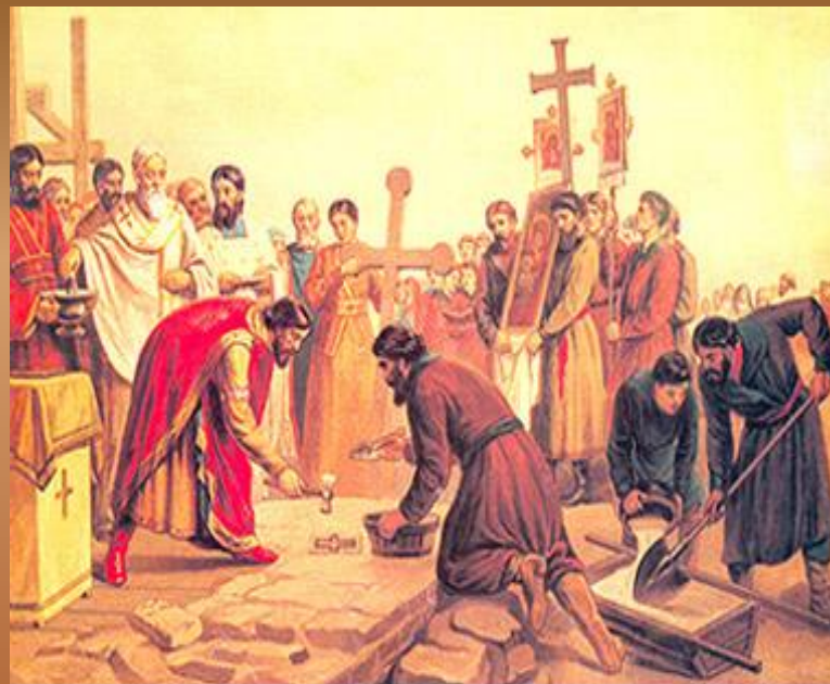
В.И. Верещагин Закладка Десятинной церкви в Киеве

«Под 6496 годом от сотворения мира (988 год примерно).