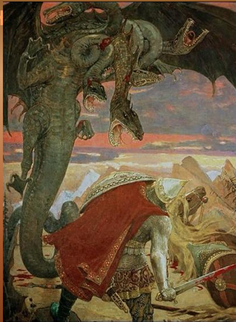
Васнецов. В.М. Бой Добрыни Никитича с семиговым змеем