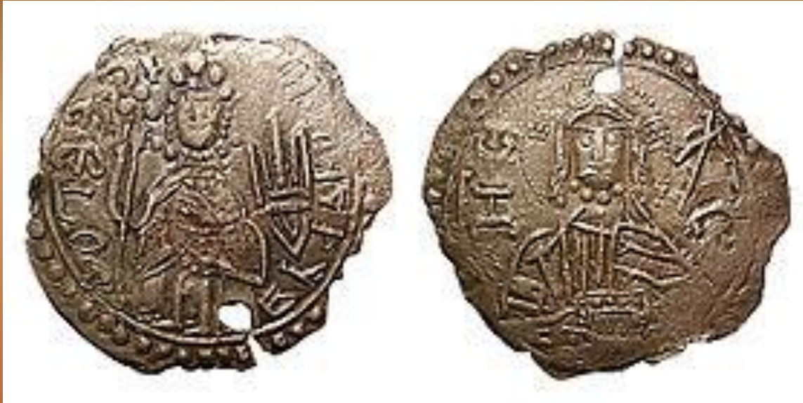
Сребренник и золотник с портретом князя Владимира