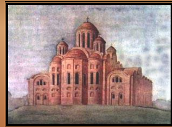
Десятинная церковь в Киеве