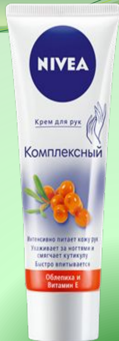
КРЕМ ДЛЯ РУК PURE&NATURAL