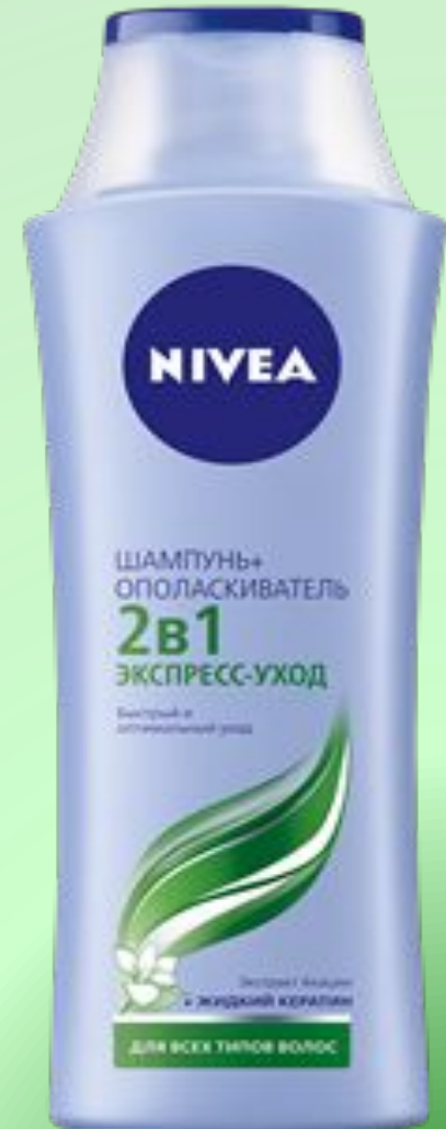
ШАМПУНЬ + ОПОЛАСКИВАТЕ ЛЬ 2 В 1 ЭКСПРЕСС-УХОД