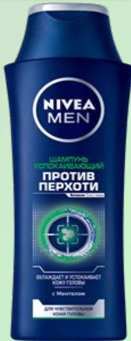
ШАМПУНЬ ПРОТИВ ПЕРХОТИ УСПОКАИВАЮЩИЙ