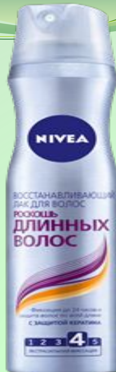
ЛАК ДЛЯ ВОЛОС РОСКОШЬ ДЛИННЫХ ВОЛОС