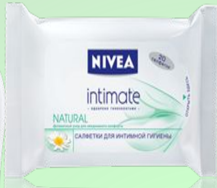
Салфетки для интимной гигиены Intimo Natural ДЕЛИКАТНЫЙ УХОД