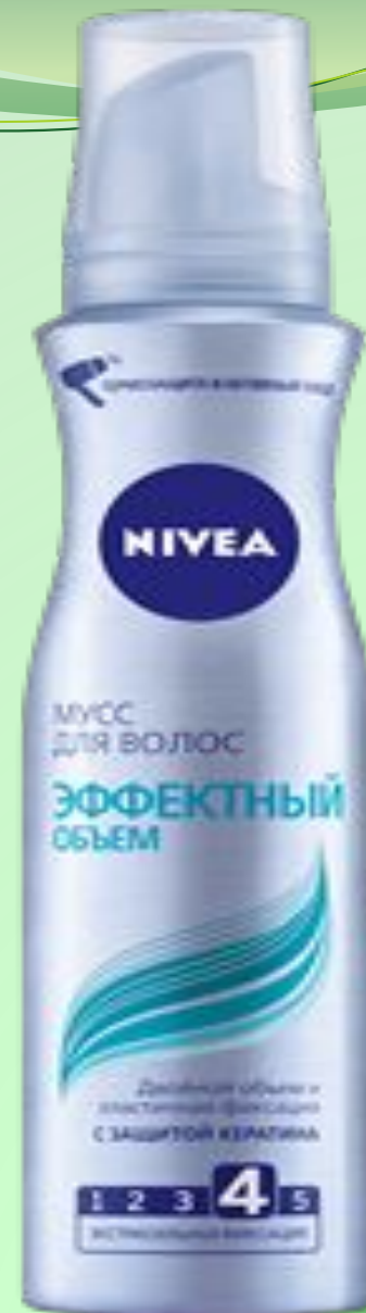
МУСС ДЛЯ ВОЛОС ЭФФЕКТИВНЫЙ ОБЪЕМ