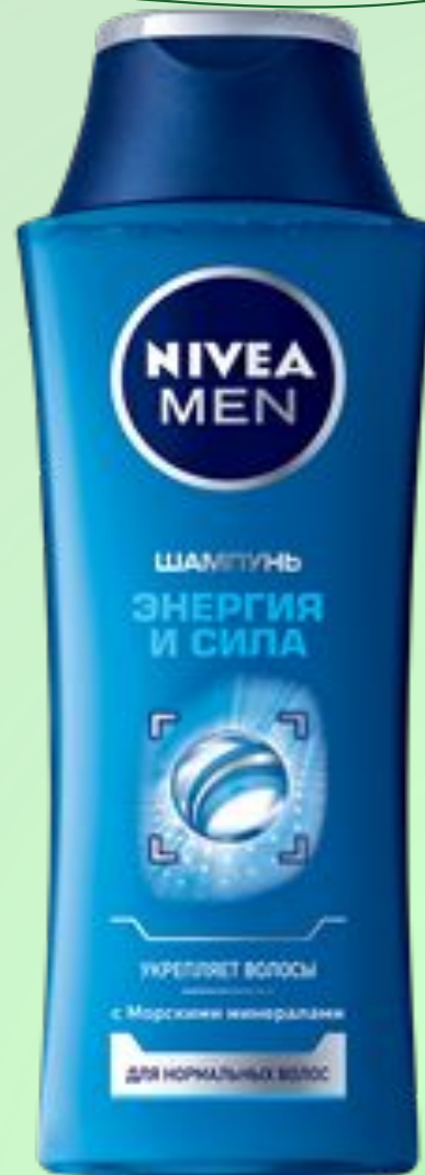
ШАМПУНЬ ЭНЕРГИЯ И СИЛА