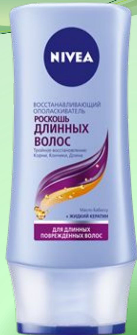
ОПОЛАСКИВАТЕЛЬ РОСКОШЬ ДЛИННЫХ ВОЛОС