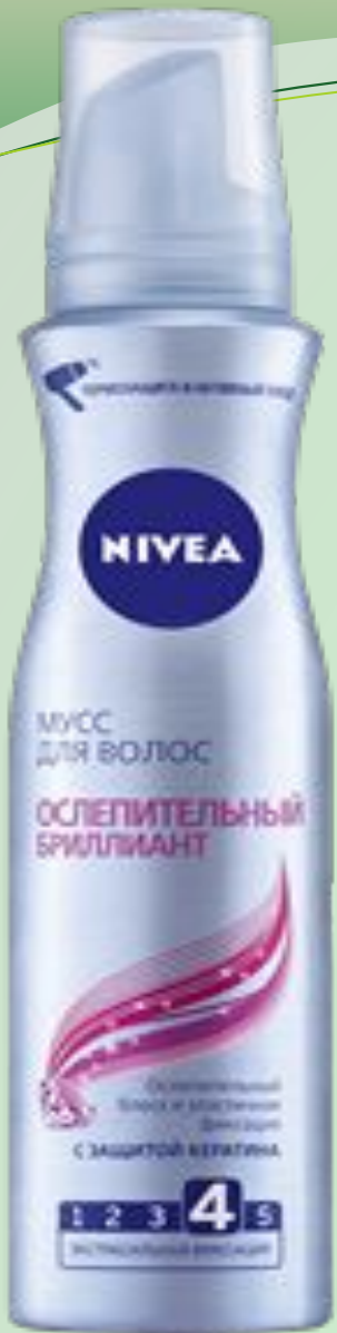
МУСС ДЛЯ ВОЛОС ОСЛЕПИТЕЛЬНЫЙ БРИЛЛИАНТ