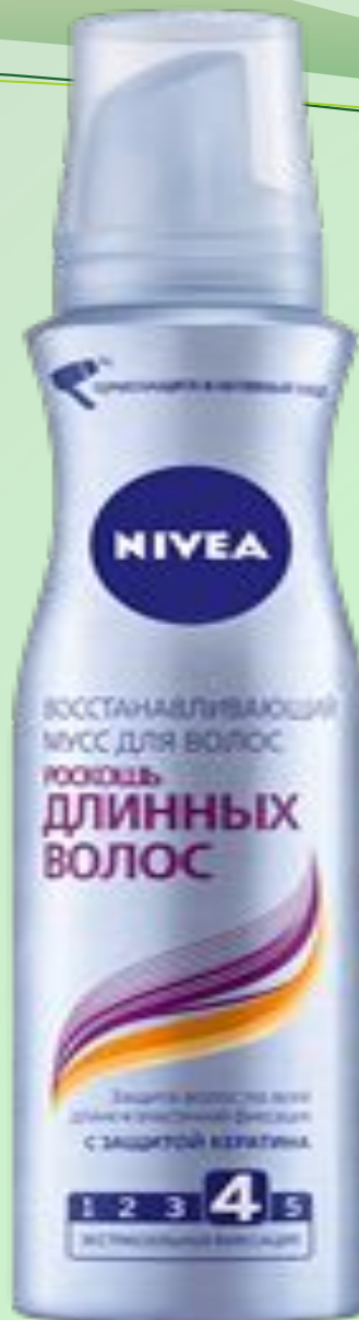
МУСС ДЛЯ ВОЛОС РОСКОШЬ ДЛИННЫХ ВОЛОС