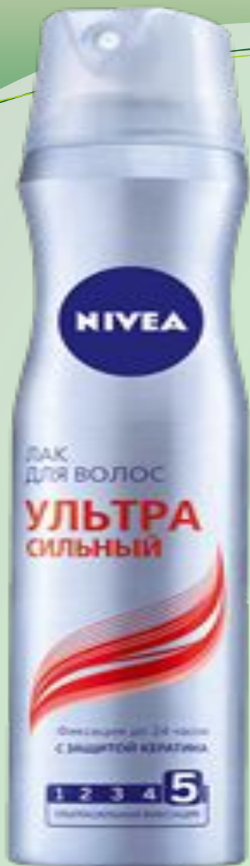
ЛАК ДЛЯ ВОЛОС УЛЬТРА СИЛЬНЫЙ