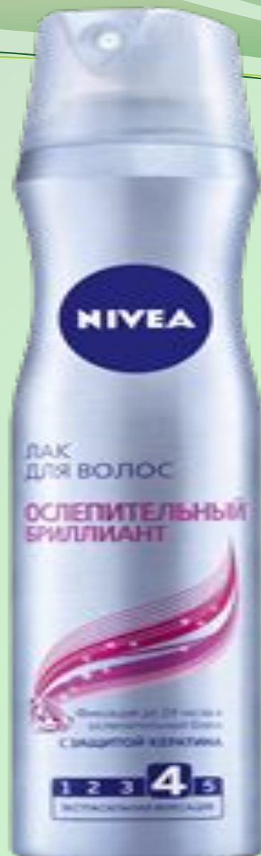
ЛАК ДЛЯ ВОЛОС ОСЛЕПИТЕЛЬНЫЙ БРИЛЛИАНТ