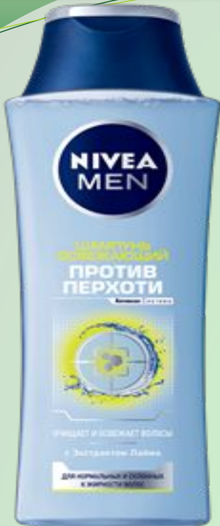
ШАМПУНЬ ПРОТИВ ПЕРХОТИ ОСВЕЖАЮЩИЙ