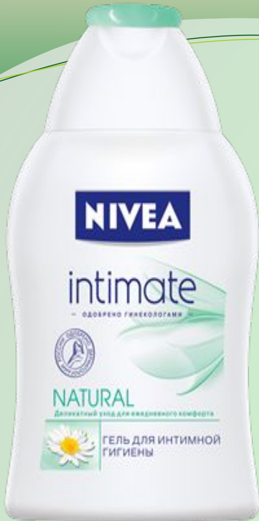
Гель для интимной гигиены INTIMO NATURAL от NIVEA с натуральным экстрактом Ромашки