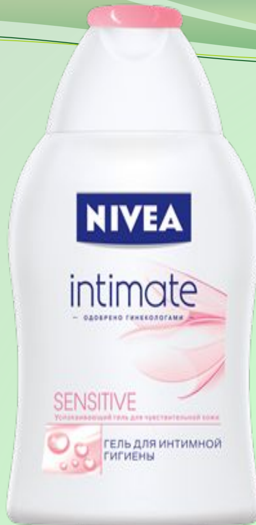
Гель для интимной гигиены SENSITIVE от NIVEA специально разработан для ухода за чувствительной кожей