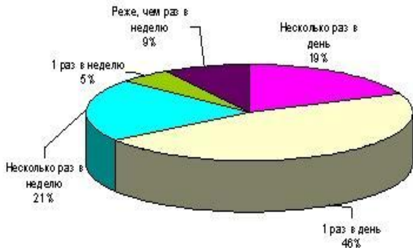
Диаграмма 3: частота использования парфюмерной продукции среди женщин**