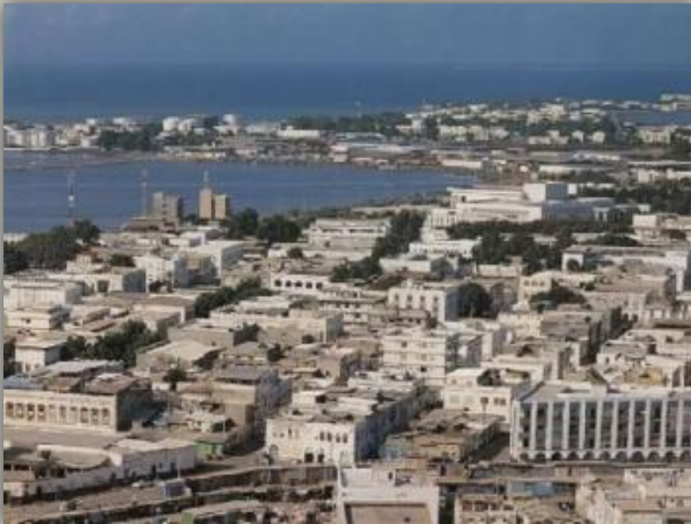
Джибути, возникла в 2004 г.

Управлением СЭЗ путем РЕГИСТРАЦИИ их в соответствующий реестр и ВЫДАЧИ УСТАВНЫХ ДОКУМЕНТОВ.