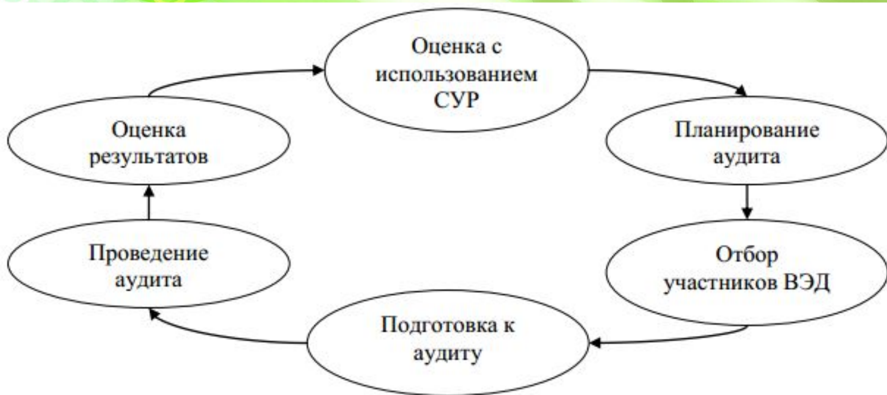
Рис. 2 Схема таможенного аудита Всемирной таможенной организации