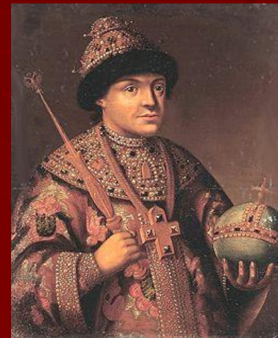
Царь Федор Алексеевич