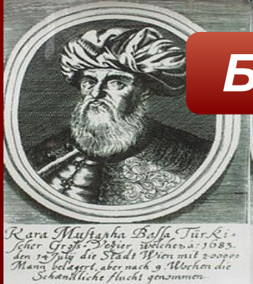
Великий визирь Мерзифонлу Кара Мустафа-паша