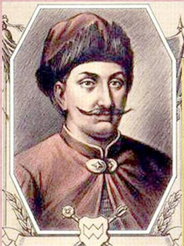
* Прокопий Ляпунов