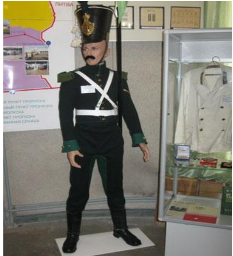
мундир таможенного пограничного объездчика

Новое серьезное изменение в таможенной форме последовало в 1946 году. Тогда был существенно расширен список предметов обмундирования таможенников, введены такие элементы как летнее и зимнее нательное белье, носки, чулки, брюки-бриджи, свитеры. Введенный новый форменный китель черного цвета предусматривал подшивку белого подворотничка. Впервые форма одежды таможенников была разделена на повседневную и парадную. Кокарда на головные уборы уже не имела на себе перекрещенных кадуцеев, а только Герб СССР.