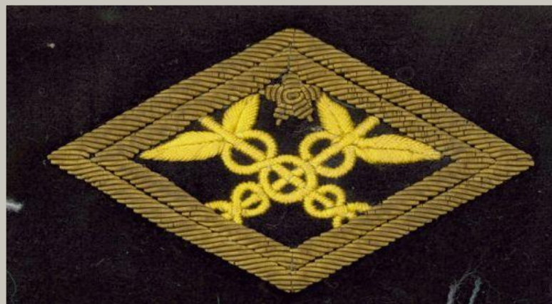
Образца 1972 года