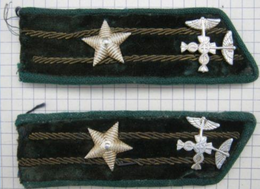
Таможенные петлицы образца 1972 года