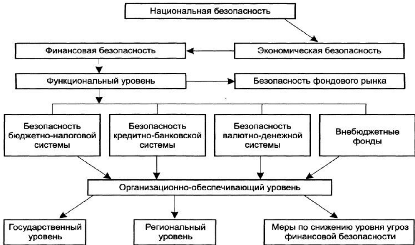
Рис. 16.1. Декомпозиция понятия «финансовая безопасность»

От развития ситуации в финансовых сегментах экономики, переплетенных между собой многочисленными связями, прежде всего и зависит стабильное и безопасное развитие экономики, учитывая, что в настоящих условиях финансово-денежные отношения пока не только не вносят позитивного вклада в реформирование российской экономики, но и оказывают сдерживающее воздействие, часто приводящее к критич