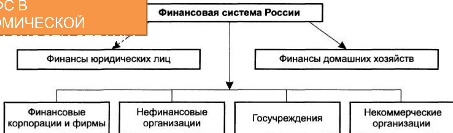
Рис. 16.3. Структура финансовой системы России

Переход к рыночной экономике обусловил усиление роли финансов и определил их новое место в системе хозяйствования. Большинство рыночных инструментов относится к элементам финансового механизма, т. е. входит в состав финансовой системы. В операциях на финансовых рынках участвуют представители всех секторов национальной экономики