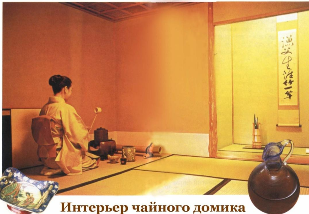
Интерьер чайного домика

Перш ніж приступити до чайної церемонії, усі учасники, концентруються на своїх відчуттях, думках та почуттях, щоб набутися необхідного психологічного настрою. Тільки так можна відчути усю духовність чайної церемонії і відчути "смак дзэн", що означає - "смак чаю".