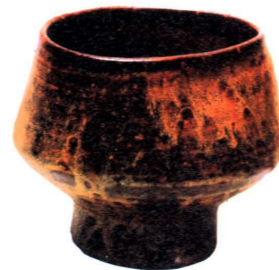
Чашки для чайной церемонии. Начало XVII в.