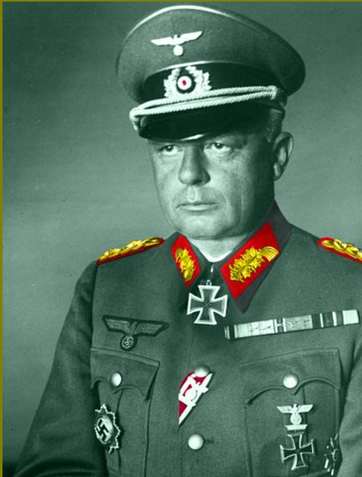
Командующий группой армий « Южная Украина» Генерал – оберст Ганс Фриснер

Перед советскими войсками оборонялась группа армий «Южная Украина» под командованием генерал-полковника Фриснера, включавшая в себя 25 немецких и 22 румынских дивизий. «Яско-Кишиневская операция» привела к полному уничтожению группы армий "Южная Украина", освобождению Молдавии, капитуляции Румынии. Штаб группы армий «Южная Украина» во главе с генерал-полковником Фриснером, потеряв связь с войсками, 23 августа бежал из Галаца в Карпаты.