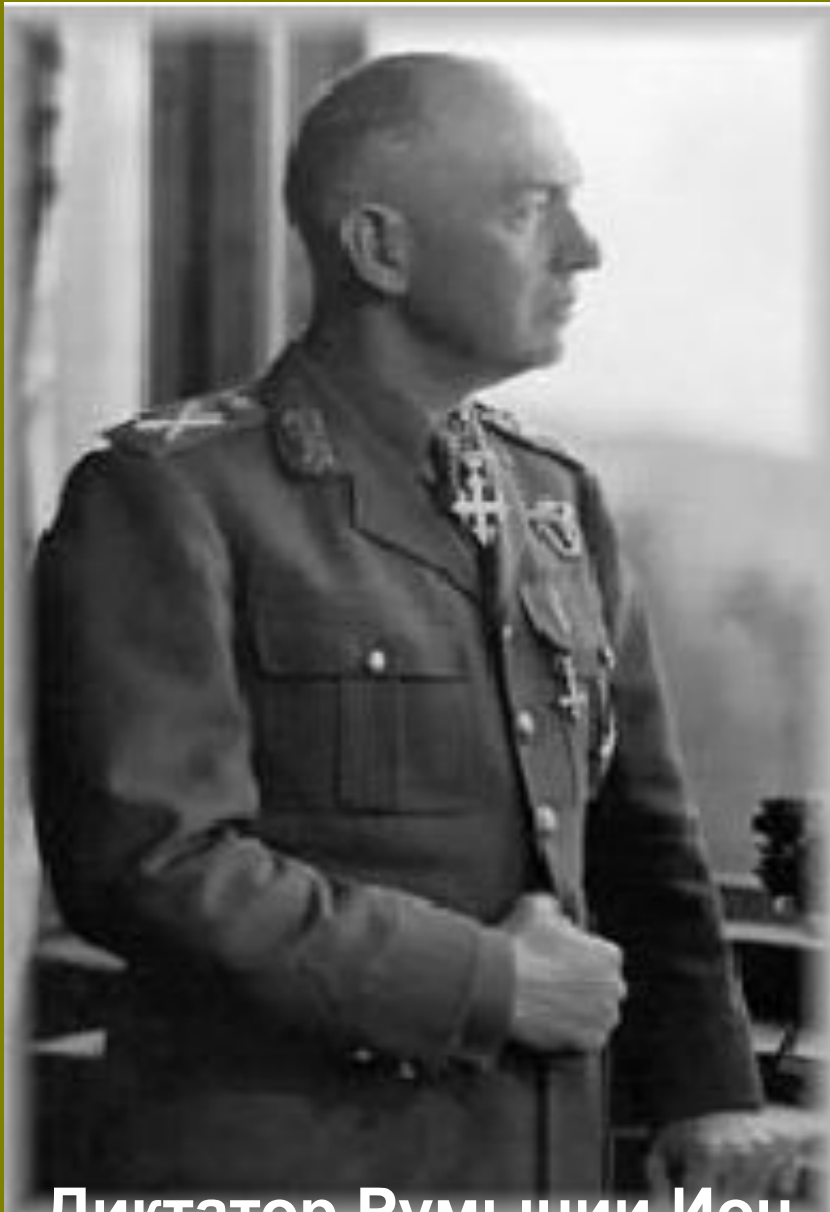
Диктатор Румынии Ион Антонеску

Кароль II в Румынии стал непопулярным королём после значительных территориальных уступок СССР, Венгрии и Болгарии. Этим воспользовалась оппозиция, «Железная гвардия» и Ион Антонеску. В ходе политических споров, 5 сентября 1940 года Кароль вынужден был отречься от престола в пользу своего сына Михая I. При короле Михеае I было сформировано новое правительство, возглавляемое Антонеску.