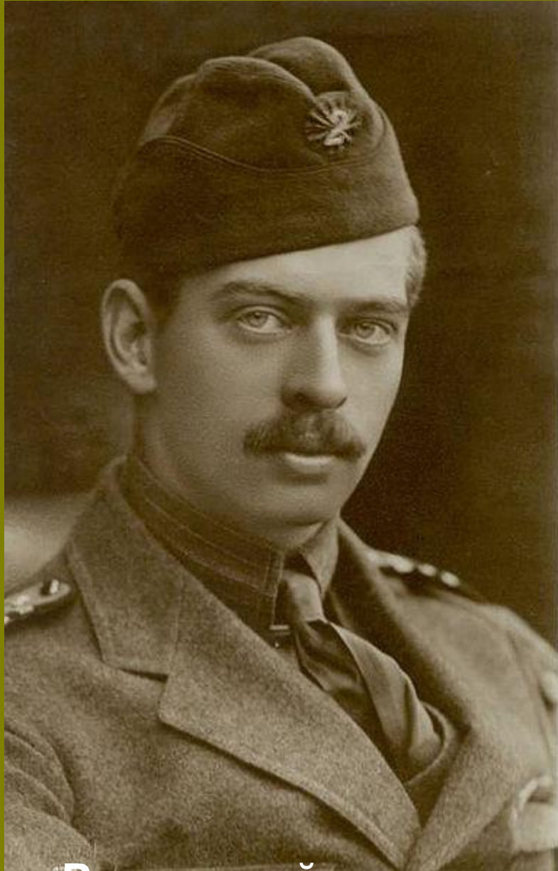
Румынский король Кароль II

После смерти отца Фердинанда в 1927 году Кароль вернулся в Румынию, сместил своего 8-летнего сына Михая I и вступил на престол. В 1938 году установил диктатуру, запретил политические партии и профсоюзы. Лишившись британской поддержки, был вынужден признать Венский арбитраж 1940 года и присоединение Бессарабии к СССР, вскоре после чего был смещён Ионом Антонеску и покинул страну, а королём вновь стал его сын Михай.