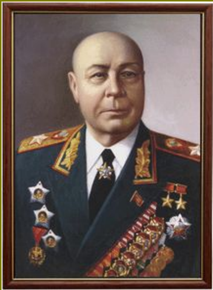
Маршал Советского Союза - Тимошенко Семён Константинович

Маршал, дважды Герой Советского Союза. Советский государственный и военный деятель, полководец. С августа 1944 года и до конца войны командовал 2, 3 и 4 Украинскими фронтами. При его участии был разработан и проведён ряд крупнейших операций Великой Отечественной войны, в том числе «Яско-Кишинёвская». Газета «Правда» 13 сентября 1944 года отмечала, что эта операция явилась одной «из самых крупных и выдающихся по своему стратегическому и военно-политическому значению в нынешней войне».