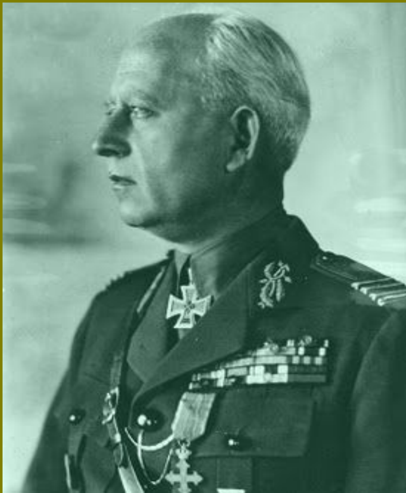
Командующий 3 румынской армией генерал Петру Думетреску

После начала «Яско-Кишинёвской операции» 1944 года армия была сбита с занимаемых рубежей по Днестру. Думитреску отступал к Бухаресту, избегая при этом столкновений с советскими войсками. Но советские войска настигли 3-ю армию, когда остатки 3-й армии подошли к Бухаресту, в плен попало около 130 000 румынских солдат. 23 августа Румыния вышла из войны, и Думитреску повернул оружие против немцев, захватив в плен около 6 000 немецких солдат.