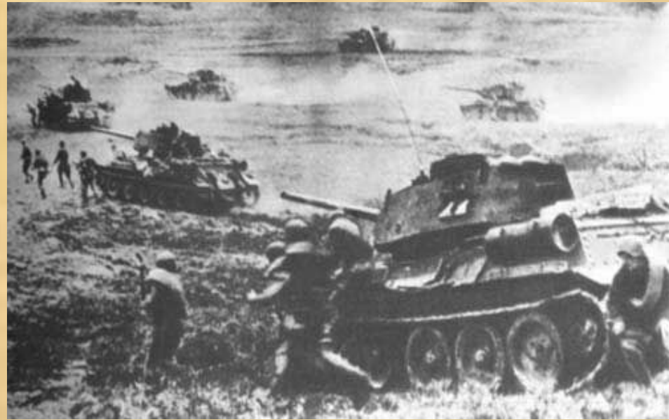
Сражение под Прохоровкой