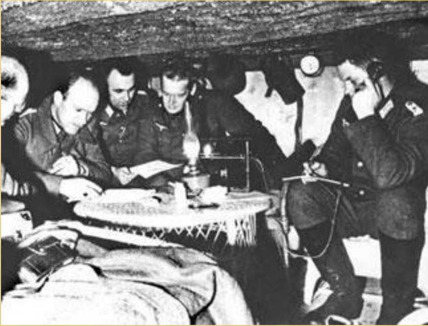
Немецкие офицеры над разработкой операции «Цитадель»

Окончательно похоронило гитлеровскую операцию "Цитадель" крупнейшее за всю вторую мировую войну встречное танковое сражение под Прохоровкой. Оно произошло 12 июля. В нем с обеих сторон одновременно участвовали 1200 танков и самоходных орудий. Это сражение выиграли советские воины. Фашисты, потеряв за день боя до 400 танков, вынуждены были отказаться от наступления.