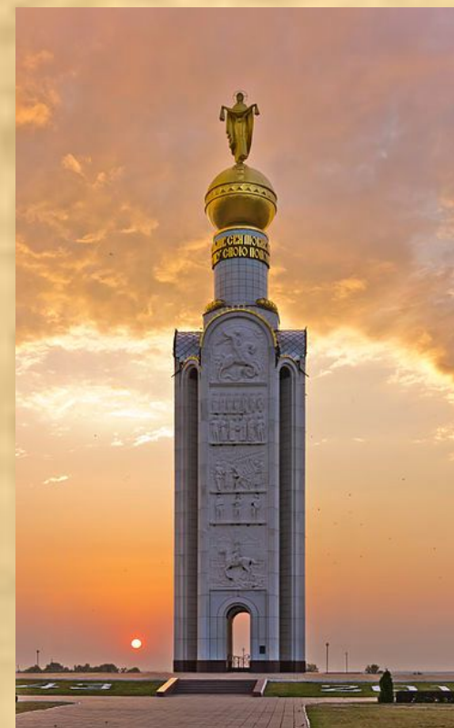
Звонница в память о погибших на Прохоровском поле