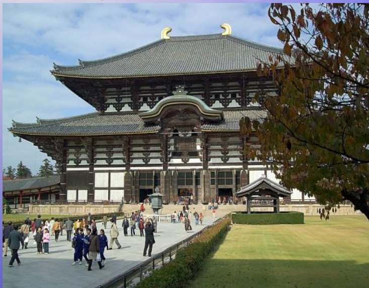
Тодай- дзи, Нара (Всемирное наследие)